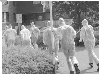
Die Fotoreihe am Fuss der Seiten dokumentiert eine Aktion in Bad Homburg. Dort besuchten Antifas nach Hausdurchsuchungen bei ihnen die dafür Verantwortlichen und „revanchierten“ sich.

■ Festnahme: „Würden Sie bitte hierherkommen“, „Kommen Sie freiwillig mit?“ ... so oder ähnlich klingt es ständig. Denkbare Reaktion: