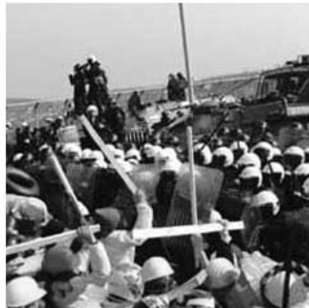
Militante Gruppe (eher selten) der ehemaligen Tutebianchi greift mit Knütteln die Polizei vor dem IWF-Kongress in Prag 2001 an.