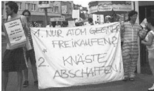
Antiknastaktion in Gießen, siehe auch www.de.indymedia.org/ 2002/08/28095.shtml