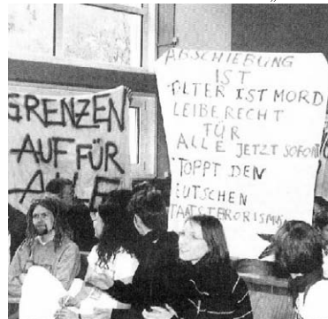
Die Fotos stammen aus dem Express, einer Wochenzeitung in Marburg ... und die Abbildungen zeigen den dort veröffentlichten Bericht.

Mehr im Direct-Action-Heft „Gerichtsverfahren“!