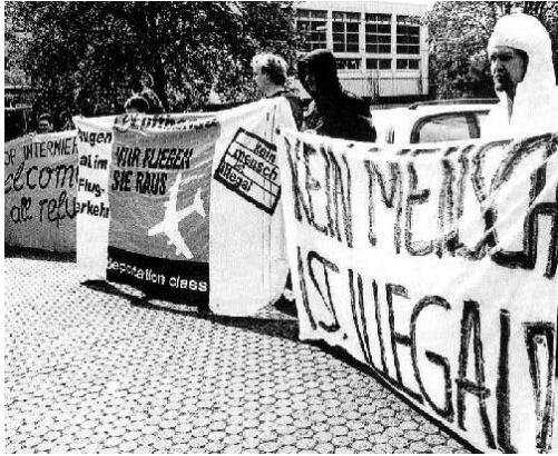
Vor dem Gerichtsgebäude ... zudem gab es einen Infostand sowie Kaffee und Kuchen.

Das folgende ist ein Bericht vom Prozeß wegen der Stopp-Deportation-Aktion im Dez. 2001 am Frankfurter Flughafen. Zielrichtung war, das Thema Abschiebung/Grenzen weiterhin zu thematisieren und das Gericht als Herrschaftsinstrument nicht anzuerkennen. Eine Woche vorher begannen Begleitaktivitäten mit Infoständen, Flugis und einer „Grenzaktion“ (Absperrung der Brücke vor der Mensa und willkürliche Selektion der FußgängerInnen nach dem Motto: „Menschen mit blauem Halstuch können wir nicht gebrauchen, das Boot ist voll, es sei denn, Sie hätten vielleicht Computerkenntnisse...“)