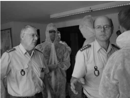
Frech durchsuchten sie Polizeistation (!) Amtsgericht. Dabei waren sie in weiße Overallis als Uniform-Verzerrung gehüllt.