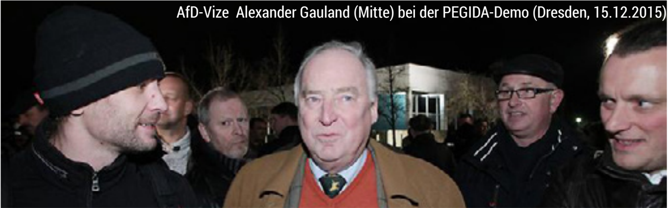
AfD-Vize Alexander Gauland (Mitte) bei der PEGIDA-Demo (Dresden, 15.12.2015)