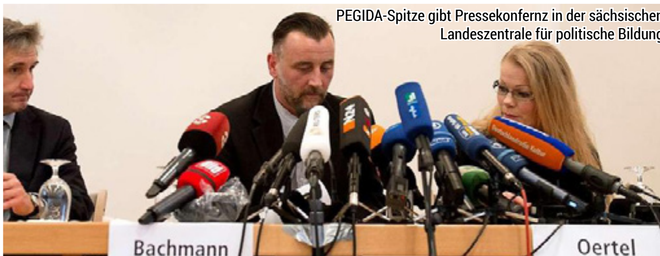
PEGIDA-Spitze gibt Pressekonferenz in der sächsischen Landeszentrale für politische Bildung

werden, weil sie es auf eine bürgerliche Klientel absehen, die zwar (proto-)faschistisch denkt, sich selbst aber für demokratisch hält.