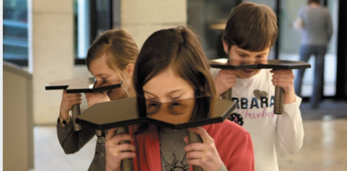
© IEF SPINCEMAILLE _ virtualground ▲