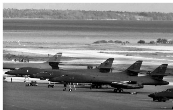
Fly på basen Diego Garcia