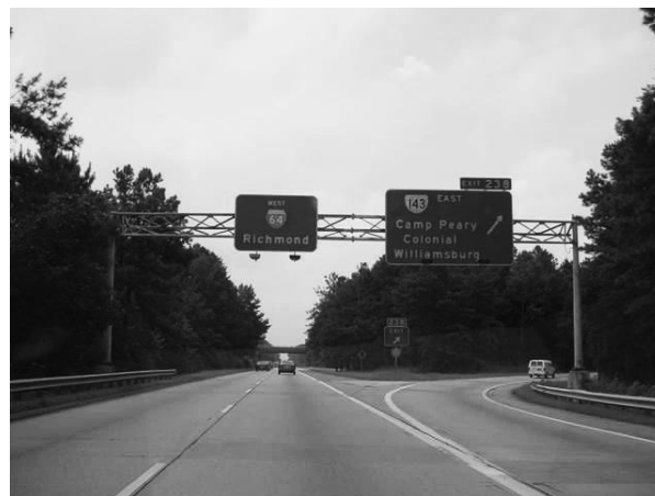
Afkørsel til Camp Peary

Allerede samme aften, som dokumentaren blev bragt, var Per Stig Møller i TV-avisen, hvor han udtalte: