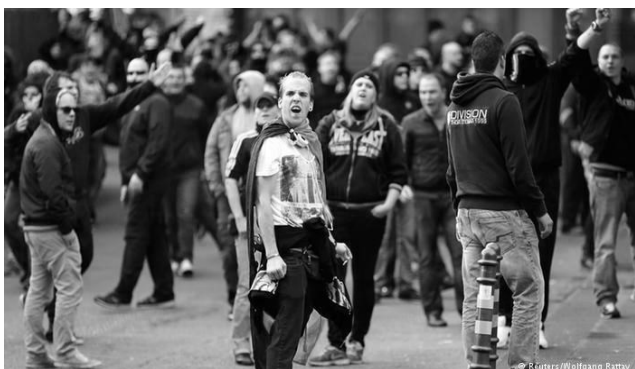
Højreekstremerne optøjer i Köln i oktober 2014