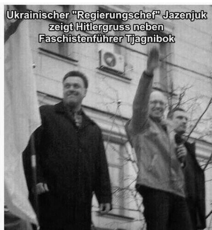
Ukrainischer "Regierungschef" Jazenjuk zeigt Hitlergruss neben Faschistenführer Tjagnibok Premierminister Yatsenyuk fra People's Front med løftet hånd til romerhilsen ved siden af Tjagnibok lederen af Svoboda. En konstruktion eller virkelighed?

Det kan trods tilbagegangen udgøre en tilstrækkelig god basis for at danne regering. Premierminister Yatsenyuk fra People's Front (som stod bag den orange revolution) ser ud til at score højst stemmeprocent på godt 21%. Det er også et ganske godt resultat for at indgå som partner i dannelsen af den nye regering, der samlet set kan blive mere "vestvenlig". Men der skal skabes nye alliancer for at få regeringen til at hænge sammen. Og som nævnt samler de ekstreme og nationalistiske partier – også knap 20 %. Ét af budskaberne i valgkampen har været, at Ukraine skal danne bro mellem Rusland og EU. Gode relationer med Rusland er indlysende nødvendige for det ukrainske parlaments gennemslagskraft