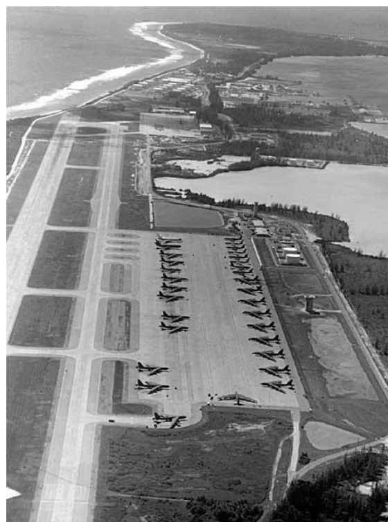
NATO basen på Carcia Diego

Vi kunne begynde med, at Danmark sagde nej tak til yderligere deltagelse. Vi kunne opbygge en Nordisk alliance og forlade NATO.