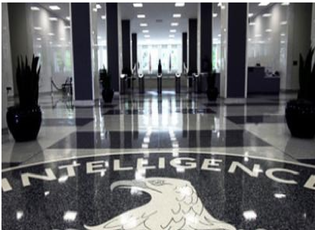
Valsen på CIAs glatte gulve.