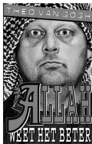
”Allah ved bedre”