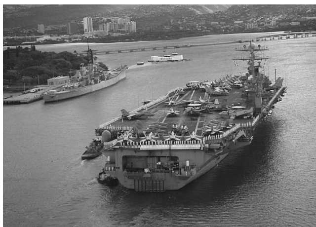
USS Carl- Vinson den flydende aktionsbase.

Flåden har endda haft adgang til en ”flydende aktionsbase”, der tjener som en ”åkande”-base for helikoptere og patruljefly i området.