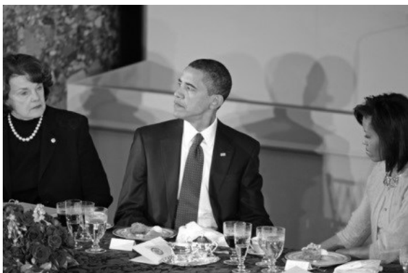
Præsident Obama i selskab med Dianne Feinstein og Michelle Obama.

Hus. Præsidenten havde ikke kun dommen fra Strassbourg at tænke på, da han sagde det, men også en undersøgelse fra det amerikanske Senat, som foreløbig har været undervejs i adskillige år, og som på over 6.300 sider beskriver CIA's hemmelige fangeprogram. Dianne Feinstein, formand for Senatets efterretningsudvalg, som står bag undersøgelsen, kalder undersøgelsen »chokerende«. »Rapporten udstiller en brutalitet, som står i voldsom kontrast til vores værdier som nation. Den fortæller om en plet på vores historie, som aldrig må få lov at gentage sig«.