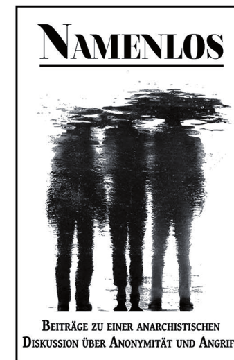
Sans nom. Contributions à une discussion anarchiste sur l'anonymat et l'attaque, Allemagne, juillet 2014, 56 p.