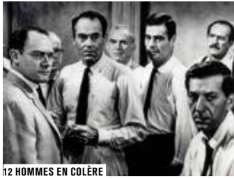
12 HOMMES EN COLÈRE

Accusés spectateurs, levez-vous! Après délibération du jury, le verdict est tombé: vous êtes déclarés coupables de flagrant délit de cinéphilie et condamnés à plonger dans les arcanes de la machine judiciaire. Toute la vérité, rien que la vérité en 80 plaidoyers de cinéma.