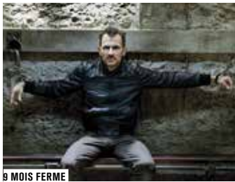
9 MOIS FERME

Accusés spectateurs, levez-vous! Après délibération du jury, le verdict est tombé: vous êtes déclarés coupables de flagrant délit de cinéphilie et condamnés à plonger dans les arcanes de la machine judiciaire. Toute la vérité, rien que la vérité en 80 plaidoyers de cinéma.