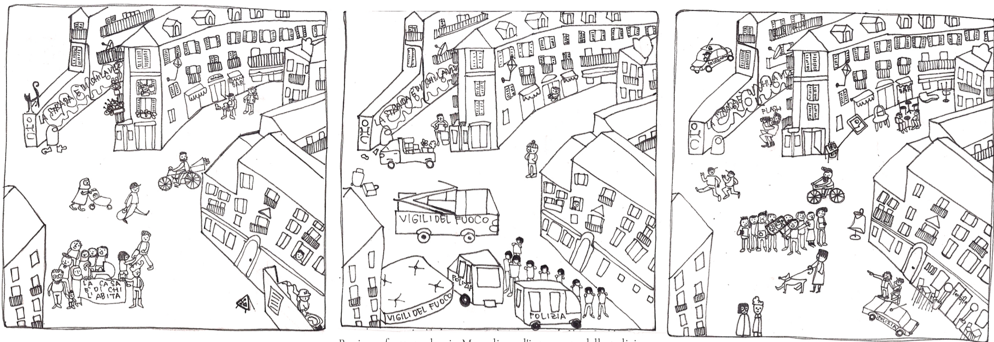
B. viene sfrattato da via Mameli con l'intervento della polizia, dopo una lunga resistenza. Un anno più tardi, L. trasloca da canale Molassi dopo aver ricevuto l'ingiunzione di sfratto.

Di pari passo al cambiamento che attraversa queste strade si affianca una narrazione, non proprio simile alla storia che è sopra raccontata, semplicemente, un modo per giustificare quest'agire; così si scrive un nuovo racconto che vuole parlare di questi muri e di queste strade rivisitando in chiave folklorica la presenza costante dello sfruttamento nella vita di chi qui ci ha vissuto. Questa narrazione diventa materia per creare un collante sociale, buona anche da vendere ai turisti di passaggio.