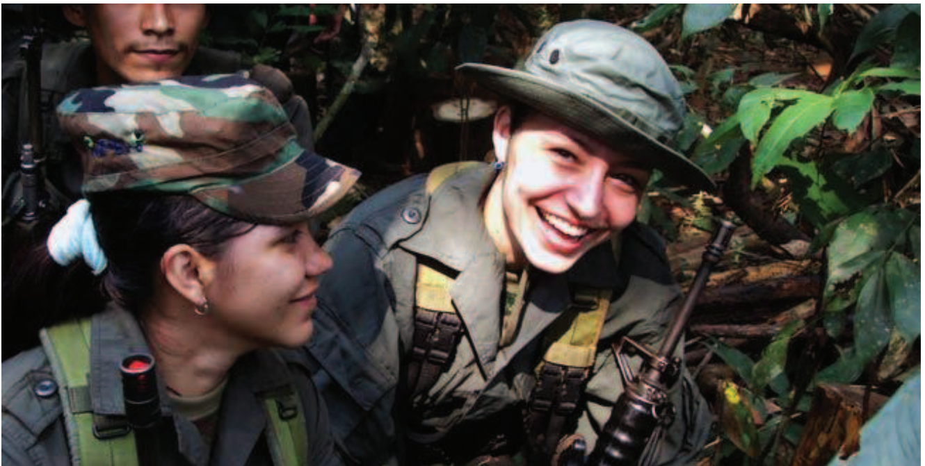
Una sonrisa guerrillera para todo el mundo!