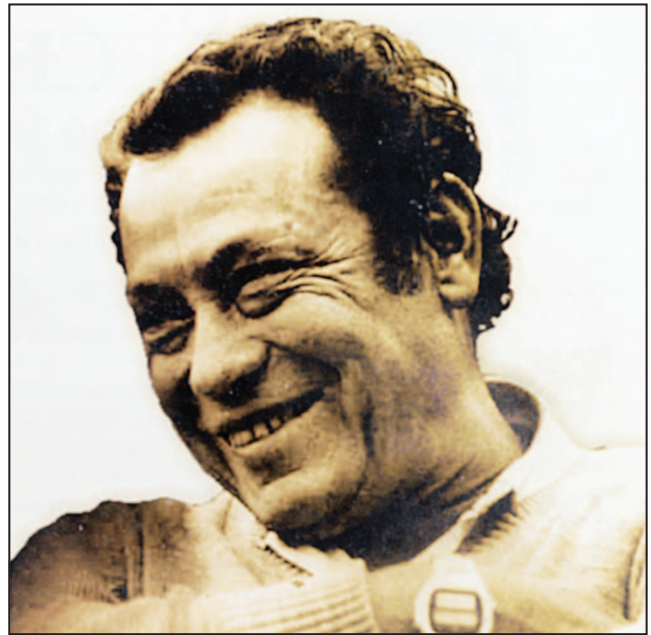
Manuel Marulanda Vélez.

Pedían entonces que conversáramos y nosotros que no, que sólo conversáramos en una zona desmilitarizada de lo contrario no; se acabó esa opción y siguió la confrontación violenta en todo el país, dura, las FARC con más fuerza con mejores resultados en las operaciones,