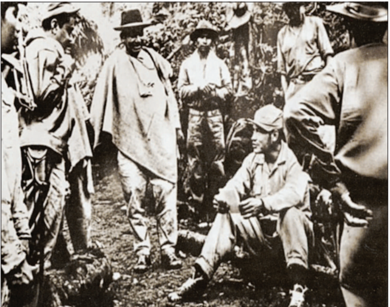
Manuel Marulanda Vélez (sentado) con fuerzas de la resistencia de Marquetalia.