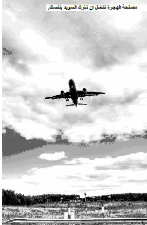
مصلحة الهجرة تفضل ان تترك السويد بنفسك.

ان مصلحة الهجرة هي المسؤولة عن تحقيق خروج جميع الذين حصلوا على رفض طلبات لجوئهم من السويد.