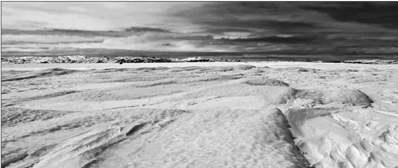
Grønlandsisen er i ferd med å smelte

Det betyr vel å merke ikke at slike prosjekter er dårlige. De kan gjerne være gode utviklingsprosjekter. Men så lenge de fører til økte utslipp, blir det helt feil å bruke dem som “kompensasjon” for utslipp i rikere land. Slike “kutt ute” er snarere “økninger ute”.