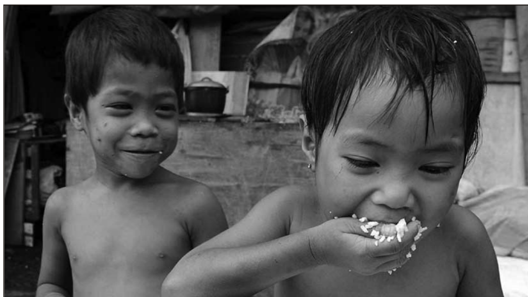
To filippinske barn spiser litt ris i verden der sulten truer mange på grunn av økte matpriser

Alle sultkatastrofer er resultat av at mat ikke kommer frem til de trengende, pga krig eller mangel på penger og kjøpekraft. Aldri på grunn av mangel på mat. Det er altså et fordelingsproblem, og ikke et produksjonsproblem vi står overfor.