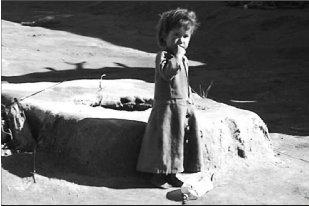
Ei lita jente i det krigsherjede Afghanistan. USAs krig for å opprettholde globalt hegemoni rammer sivilbefolkningen hardt.

mot okkupasjonen men som var villige til å alliere seg med USA for en blanding av penger og beskyttelse fra både Malikis regjering og sektariske fanatikere som Al Qaeda.