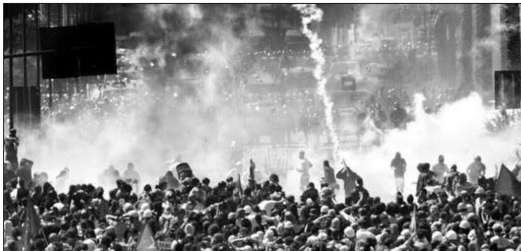
Bildet er fra G8-møtet i Genua i 2001 der hundretusener demonstrerte. Et par år senere demonstrerte to millioner mennesker på ESF i Firenze mot krigen som truet i Irak. Rifondazione Comunista var svært viktig for disse mobiliseringene.

” For årsaken til Berlusconis comeback og venstresidens nederlag ligger først og fremst i millioner av menneskers skuffelse over Prodi-regjeringens politikk – en regjering der den radikale venstresiden inngikk.