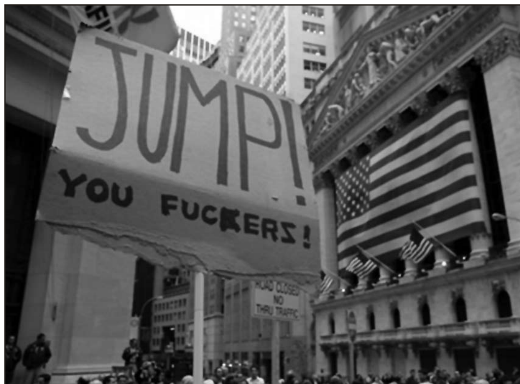
Både fagbevegelsen og andre aktivister har protestert hølytt mot redningspakka til Wall Street

Han må ha følt seg dum da Wall Street ble rammet av kaos etter kollapsen til investeringsbanken Lehman Brothers mandag 15. september. Det er nå klart at en global økonomisk nedgang er under oppseiling og den vil ramme alle de viktige regionene i verdenskapitalismen. Som alltid er nedgangen ujevn. I den siste perioden det fin-