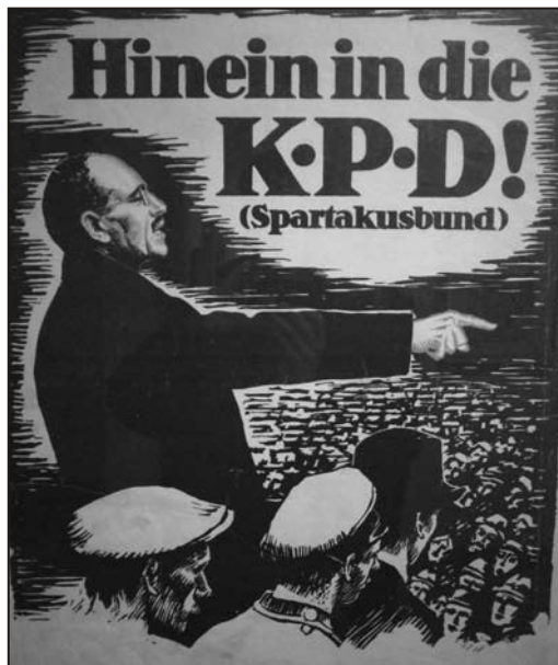
Liebknecht vil ha folk inn i KPD

Men seieren over revolusjonen var bare foreløpig. Store deler av Tyskland var fremdeles under innflytelse av arbeider- og soldatrådene. I revolusjonens begynnelse var SPD i stand til å dominere rådene. En viktig grunn til at opprøret i Berlin ble slått tilbake forholdsvis enkelt, var at en stor del av byens arbeiderklasse hadde illusjoner om SPD og ønsket en ordnet parlamentarisk overgang til det de oppfattet som sosialisme.