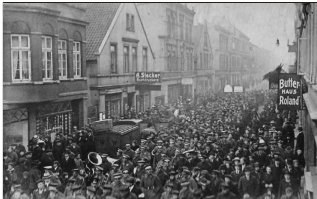
Massedemonstrasjon i Kiel 6. november 1918

Den tyske revolusjonen var en del av et større revolusjonært oppsving i kjølvannet av 1. verdenskrig. I januar 1917 ekskluderte SPD (Sosialdemokratene) samtlige opposisjonelle og 170 000 forlot partiet. 120 000 av dem dannet Det Uavhengige