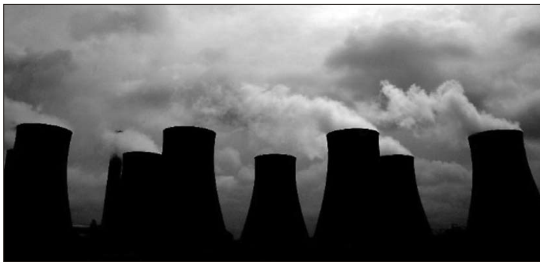
Å «kutte ute» ved bruk av CDM-mekanismen, kan like gjerne føre til økte utslipp av CO 2

” Å bruke slike prosjekter politisk og ideologisk som argument for å slippe en del utslippskutt i rikere land og “kompensere” våre egne utslipp, vil bare føre oss nærmere katastrofen.