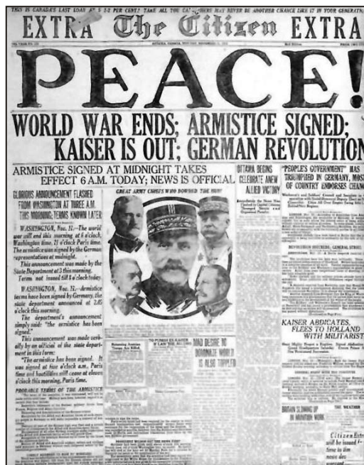
Avisa The Citizen forteller om fred, verdenskrigens slutt og tysk revolusjon på forsida

Demonstrasjonen var bevæpnet. Liebknecht ledet en kolonne med arbeidere og soldater for å overta det keiserlige palasset. Eichorn, USPD-medlem, ledet en annen kolonne for å overta politihovedkvarteret der han ble innsatt som ny revolusjonær politisjef. Makta syntes å gå rett fra keiseren og hans venner til revolusjonære sosialister.