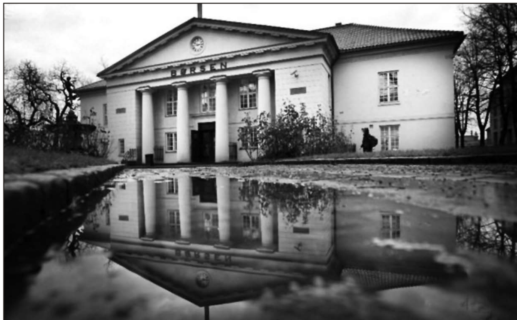
Oslo børs har oppført seg som en jojo de siste ukene. Siden nyttår har aksjekursen falt med mer enn 45 prosent

Noen av redningspakkene innebærer å låne bankene penger - å få likviditet i markedet som de formulerer det - å forsøke å oppmuntre dem til å låne ut til hverandre. Andre innebærer å kjøpe opp all den stygge gjelda slik at publikum, i stedet for bankene, blir ansvarlig for den. Ikke overraskende er bankene fornøyde med denne type redningspakker.