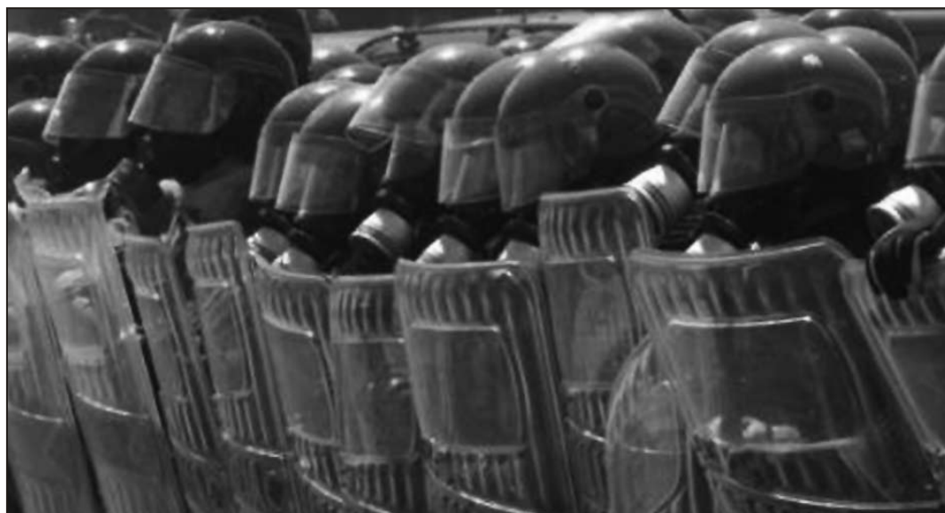
Også i nyere tid blir politi brukt mot opprør nedenfra. Bildet viser politi ved G8-møtet i Genova i 2001

Også i det sentrale Tyskland var det store kamper. Den 23. februar proklamerte en konferanse for rådene av gruvearbeidere, elverksarbeidere,