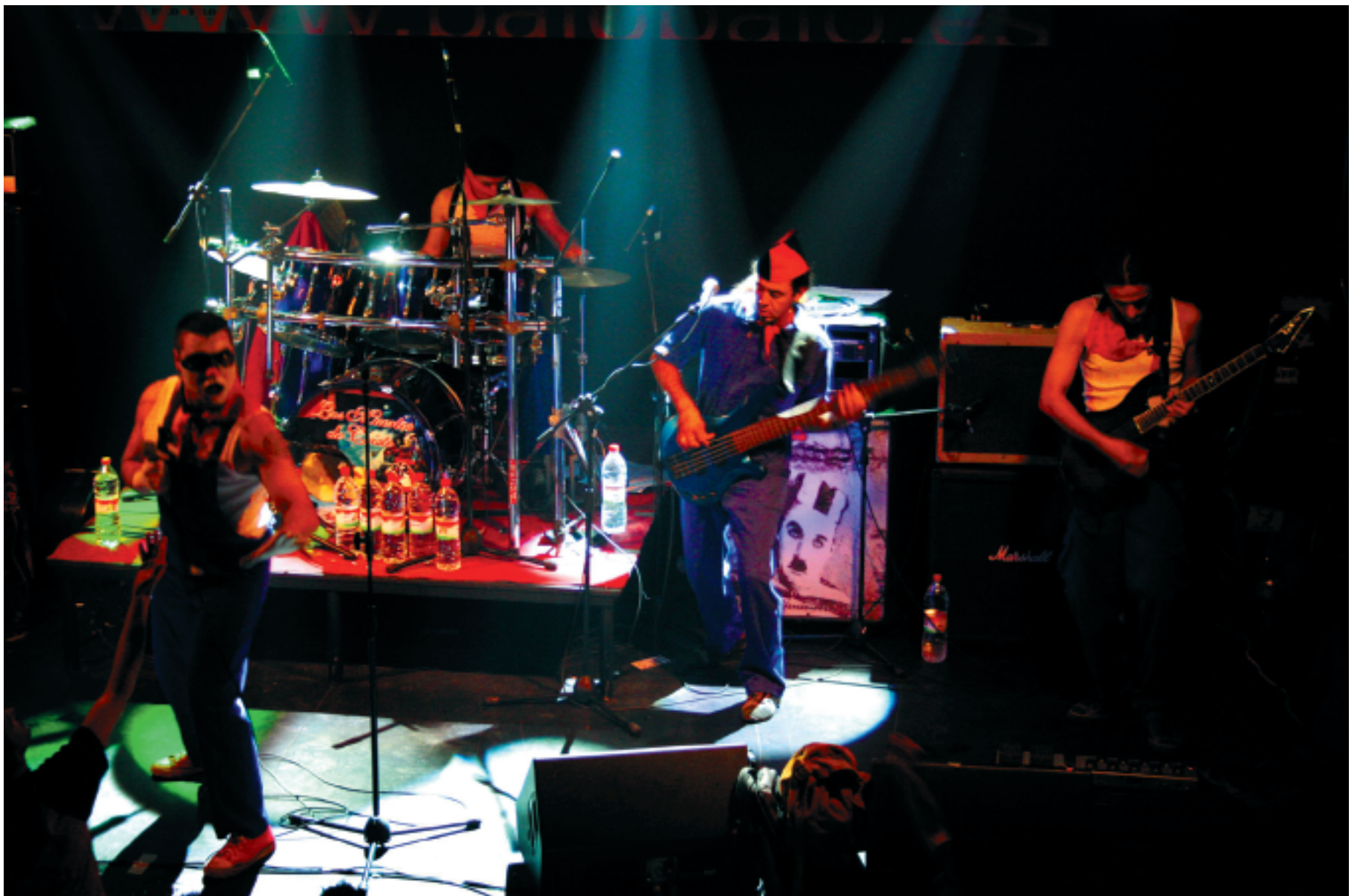
LMC en plena actuación en la sala El Grito

Sí, hemos donado todo lo que son los derechos, es decir que la FAL, por ejemplo me llamaba a mí para sacar una canción, es decir, pedían permiso, entonces cuando tú te retiras (nosotros no estamos de autores ni nada de eso), entonces ¿qué ocurre?, que puede llegar un listo y claro. Yo ya no voy a estar pendiente de esta movida, entonces lo mejor que se puede hacer con un material que sale, que se vende, porque es un mate-