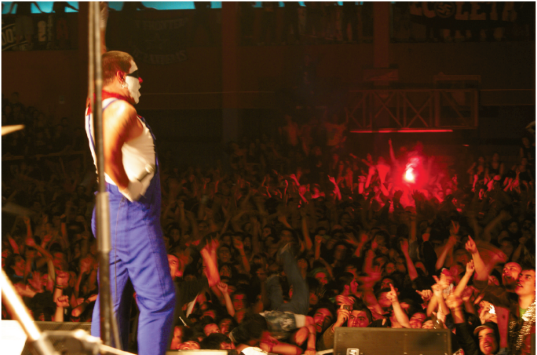
Panorámica de la sala El Grito durante el concierto

« la gente, nosotros hace años que acabamos con otro tipo de comportamientos, esos se fueron, decían que éramos demasiado intelectuales para ellos (se ríe), no, es que, no bebíamos, no nos drogamos, no éramos lo suficiente macarras, así que a ellos no les cuadraba.