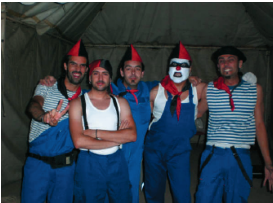
Última formación de Los Muertos de Cristo