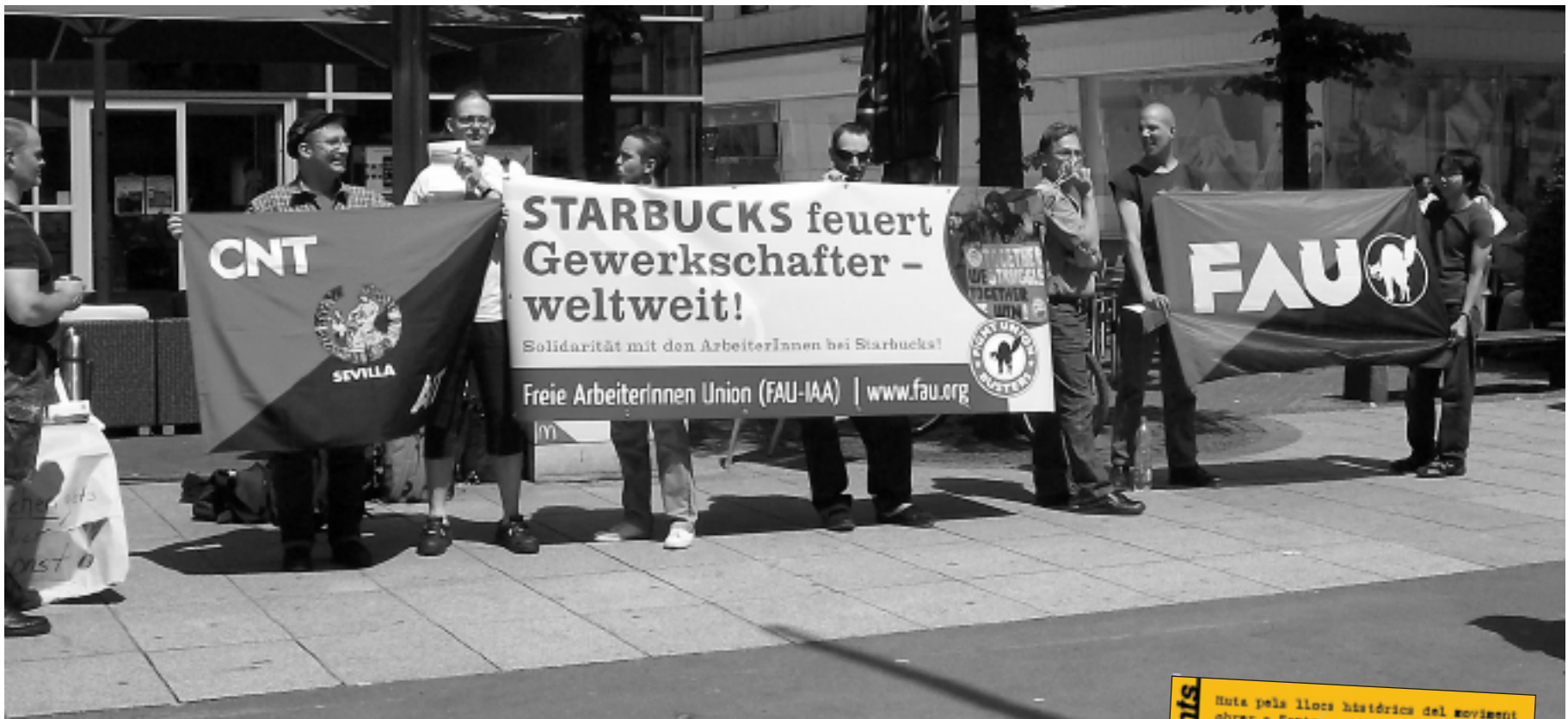
Concentración en el primer Día de Acción Global contra Starbucks en Duisburg (Alemania)

El pasado 5 de julio, sindicalistas y activistas de todo el mundo se han concentrado frente a más de 300 cafeterías Starbucks protestando por la represión sindical de la multinacional en España y Estados Unidos. En total, más de 80 ciudades de 20 países distintos han sido testigos, una vez más, de la solidaridad internacional promovida por la AIT y la IWW.