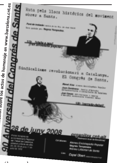
Más información sobre los actos de homenaje en www.barcelona.cnt.es

Salvador Seguí: "La trascendencia del Congreso radica en que nos da la posibilidad de llevar a nuestras organizaciones el máximo de su potencia. Para ello no tenemos más que poner en práctica las pautas de organización que