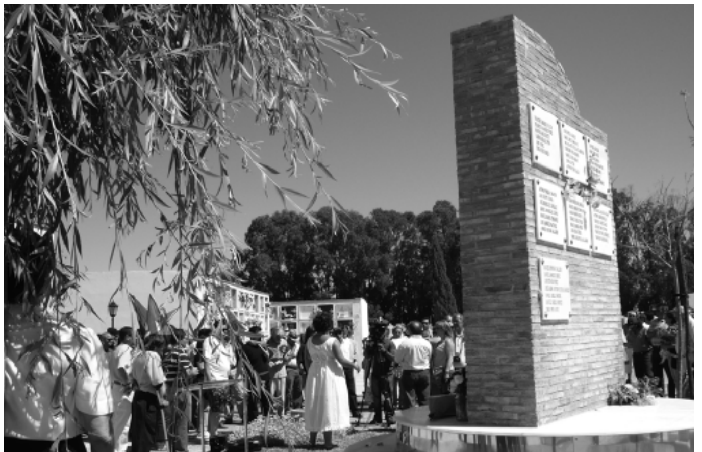
Homenaje a los represealiados por el franquismo en Puerto Real el 15 de junio de 2008

La exhumación no compete solamente a los familiares y a la Asociación sino también a las