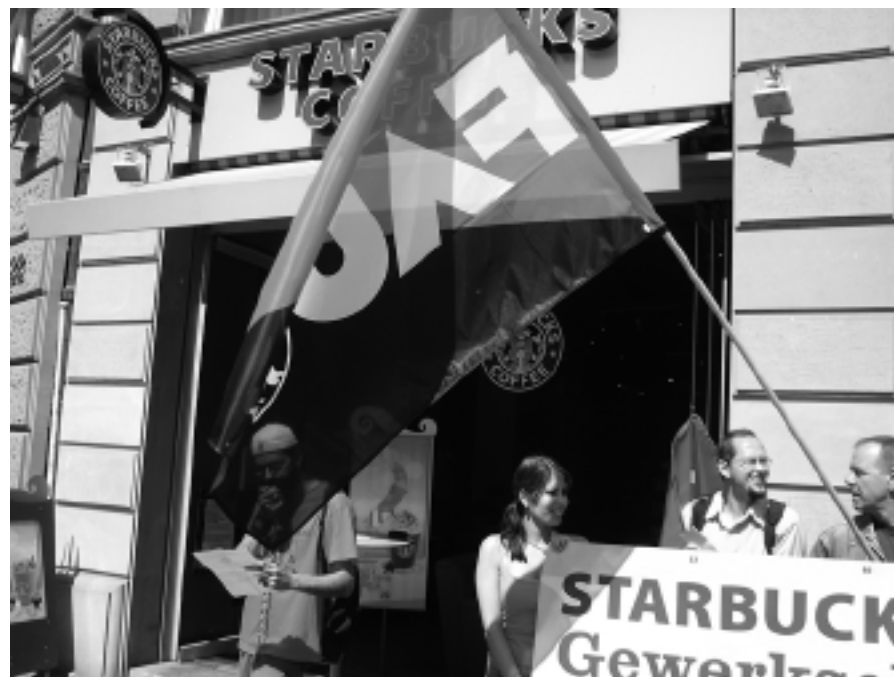
Concentración de militantes de la sección alemana de la AIT ante una cafetería Starbucks en Frankfurt (Alemania)

Los organizadores de la campaña, el Sindicato de Comercio y Hostelería de la CNT-AIT de Sevilla y el Sindicato de Trabajadores de Starbucks de Gran Rapids de los IWW, consideran un éxito la convocatoria y anuncian nuevas acciones hasta que los sindicalistas no sean readmitidos. Recuerdan a los trabajadores que se organicen en sindicatos de base y hacer uso de las redes de solidaridad internacional, siendo la mejor forma de defender sus derechos laborales.