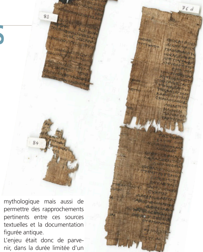
Texte de Callimaque sur un papyrus de Lille