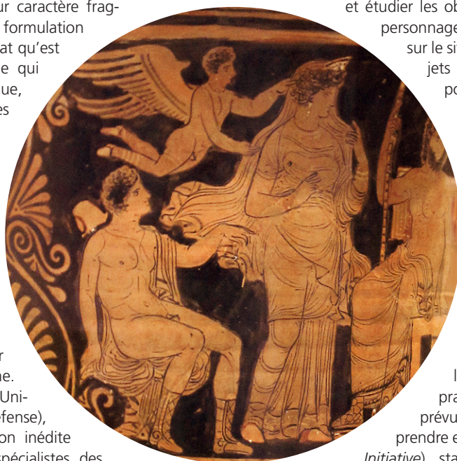
Adonis assis près d'une déesse et survolé par Éros (vase apulien du IV e av. J.-C.)

La phase d'évaluation de l'état de l'art sur les outils numériques et les pratiques de l'édition électronique, prévue dans le projet CAIM, a permis de prendre en considération la TEI ( Text Encoding Initiative ), standard international utilisé pour le traitement numérique des textes. Il était donc nécessaire de se rapprocher de spécialistes de ce standard et, dès le début, un dialogue a été amorcé avec TELMA (Traitement Électronique des Manuscrits et des Archives). Le partenariat qui en a résulté a porté