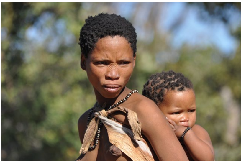
Une femme bushman et son enfant

Chez les chasseurs-cueilleurs, on peut citer par exemple les Bushmen des déserts du sud de l'Afrique, rendus célèbres il y a quelques années par le film Les dieux sont tombés sur la tête .