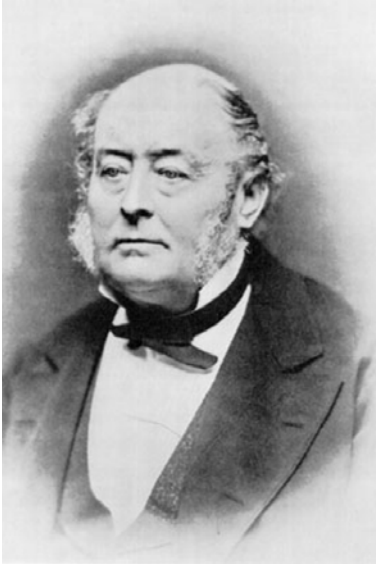
Johann Jakob Bachofen (1815-1887)

convaincu de l'existence d'une antique et universelle religion de la « déesse-mère ». Selon lui, cette prééminence des femmes avait culminé sous la forme de « l'amazonat », c'est-à-dire de leur domination par les armes sur les hommes. Ceux-ci étaient ensuite parvenus à renverser les rôles et à imposer le patriarcat duquel les sociétés occidentales n'étaient toujours pas sorties. Outre les récits des auteurs grecs, Bachofen mobilisait à l'appui de son propos les traces archéologiques (des inscriptions sur les tombes des cimetières) et surtout l'analyse des mythes,