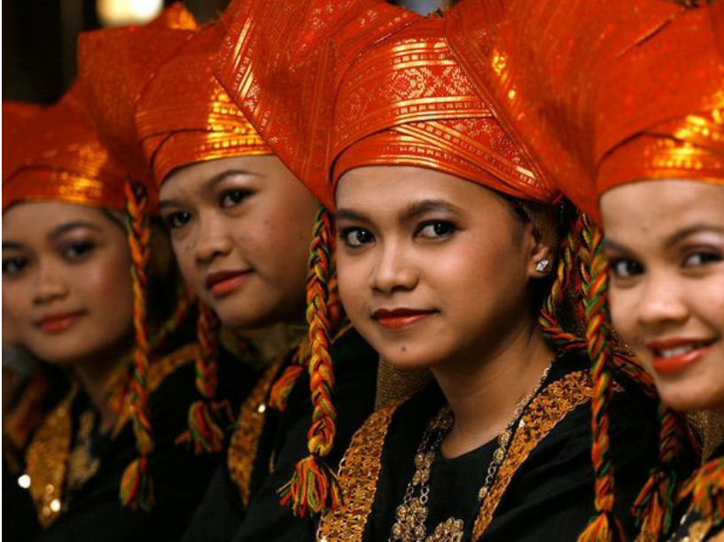
Femmes minangkabau en costume traditionnel. Chez ce peuple de l'île de Sumatra, pourtant islamisé depuis plusieurs siècles, ce sont elles qui possédaient les maisons, les champs et même les bovins .

ont été parfois en situation de contrebalancer, partiellement ou totalement, les pouvoirs des hommes.