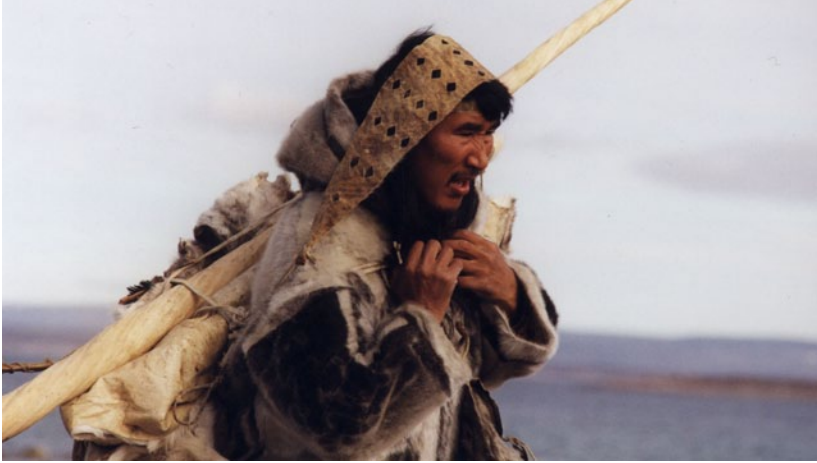
Un chasseur inuit

vues comme un sujet sans importance particulière parmi les Inuit. Elles ne constituent pas un motif de vendetta de la part de sa parenté (...) L'agression physique et verbale entre les hommes est réprouvée, mais l'agression sexuelle contre les femmes sous la forme du rapt ou du viol est courante 1 . »