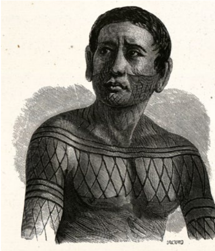
Un Indien Mundurucú

Dans tout le bassin amazonien, on retrouve bien des points communs avec la Nouvelle-Guinée. Là aussi, qu'il s'agisse de sociétés de purs chasseurs-cueilleurs égalitaires ou de peuples se livrant à une agriculture itinérante, les femmes étaient globalement dominées par les hommes. Et là encore, ceux-ci pratiquaient