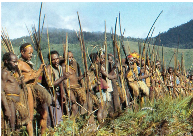
Un rassemblement de guerriers Baruya

Les Baruya ne sont nullement une exception. L'ensemble de la Nouvelle-Guinée, au-delà des différences parfois très importantes d'un peuple à l'autre, était tout entière marquée par une domination masculine très affirmée. Certaines de ces sociétés, contrairement aux Baruya, connaissaient les inégalités de richesses. Mais d'un point de vue technique, tous ces peuples se situaient peu ou prou au stade atteint par les Iroquois, pratiquant des formes rudimentaires d'agriculture et d'élevage et utilisant des outils de pierre.