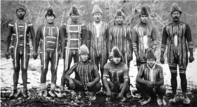
Hommes Selk'Nam en peintures cérémonielles

À un marin britannique qui s'étonnait que les Selk'Nam ne connaissent aucune espèce de chefs, l'un d'eux, qui parlait quelques mots d'anglais, répondit : « Nous sommes tous des capitaines. » Avant d'ajouter : « Et nos femmes sont toutes des matelots 3 . »