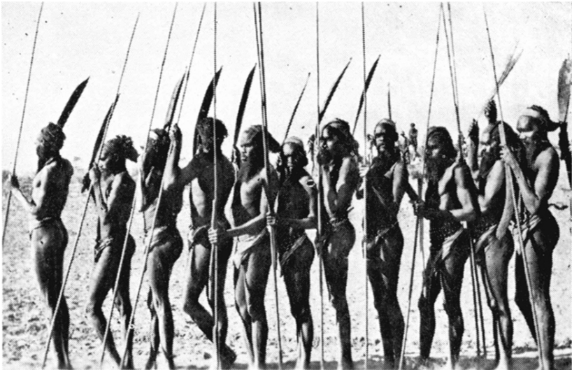
Guerriers australiens. Là comme ailleurs, dans de tels rassemblements, les femmes sont bien rares !

Sans aller plus loin dans cette question qui reste à l'heure actuelle largement non résolue, on peut en revanche noter que ce monopole masculin sur la chasse et les armes a partout donné aux hommes une position de force vis-à-vis des femmes. Le sexe qui détenait le monopole des armes exerçait de ce même fait un monopole sur ce que l'on peut appeler la « politique extérieure », c'est-à-dire la gestion des relations, pacifiques ou belliqueuses,