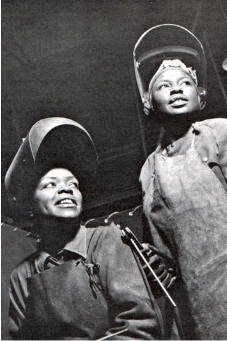
Un travail d'homme ? Ouvrières sur les chantiers navals aux États-Unis pendant la Deuxième Guerre mondiale

efforts devront s'échanger contre une certaine somme d'argent, le capitalisme établit que leur travaux, pouvant être mesurés par un étalon commun, sont constitués d'une substance unique. « À travail égal, salaire égal ! », ce slogan de toujours des femmes prolétaires, prend précisément pour point d'appui le fait que dans le capitalisme, le travail d'une femme ne se différencie en rien de celui d'un homme — en rien, si ce n'est par la quantité d'argent qui le rémunère.