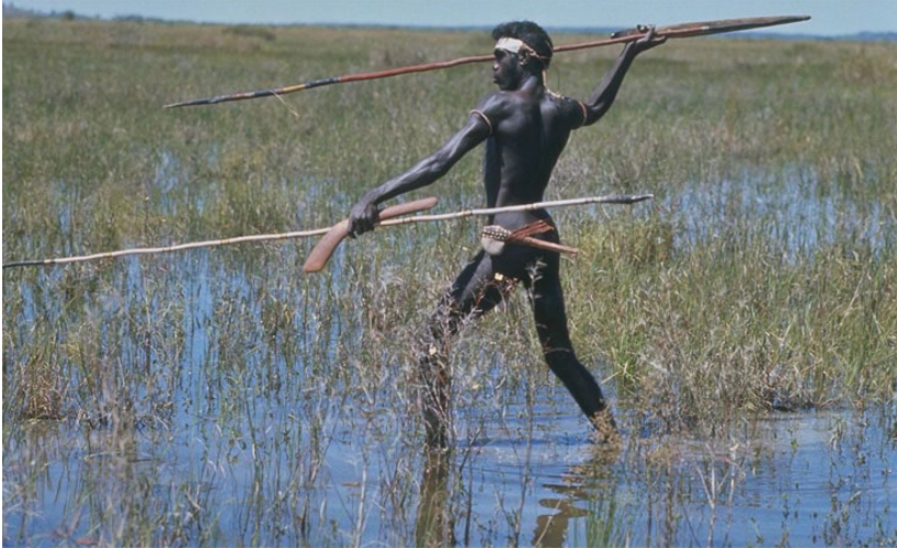
Un aborigène chassant au propulseur L'Australie était le seul continent où l'arc était inconnu.

uniquement de chasseurs-cueilleurs nomades et égalitaires, dont les rares relations avec des sociétés aux techniques plus avancées n'avaient guère influencé le mode de vie. Partout ailleurs sur la planète, même là où ils avaient conservé leur autonomie, les chasseurs-cueilleurs nomades avaient été relégués dans les environnements les moins hospitaliers : sur la banquise du Grand Nord, dans les toundras subarctiques, dans les déserts arides ou dans les épaisses forêts équatoriales. En Australie, au contraire, les Aborigènes occupaient des milieux au climat et à la topologie très diversifiés. À cette particularité, déjà remarquable en elle-même, s'ajoutait une originalité technique : ils étaient les seuls chasseurs-cueilleurs jamais observés à avoir ignoré l'arc.