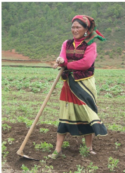
Une femme Na (Mosuo)

Certaines d'entre elles sont organisées selon le « droit maternel » dont parlait Bachofen : les individus sont répartis dans des groupes de parentés, des clans, où l'appartenance est transmise uniquement en ligne féminine. Mais contrairement à ce que pouvaient croire Bachofen, Morgan ou Engels, les clans matrilineaires ne sont pas synonymes d'une haute situation des femmes. Les Nharo, les Andamanais ou les Mbuti n'ont pas du tout de clans, et donc pas de matrilinearité. Cela n'empêche pas les femmes d'y occuper une position favorable. Inversement, la Nouvelle-Guinée, l'Australie ou l'Amazonie sont emplies d'exemples de sociétés matrilineaires où les femmes sont néanmoins très clairement infériorisées.