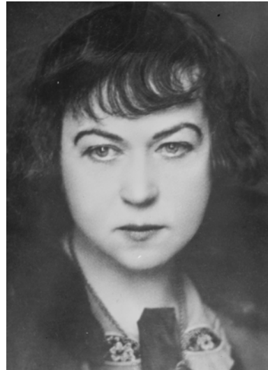
Alexandra Kollontai (1872-1952)

Au sein de celui-ci, il continua de régner durant quelques années une atmosphère de libre discussion ; ainsi, certaines des thèses de Morgan et, par contre-coup, d'Engels, furent rapidement remises en cause par le développement des connaissances ethnologiques. La dirigeante bolchévique Alexandra Kollontai, par exemple, s'y employa au début des années 1920 dans ses Conférences sur la libération des femmes . Mais le débat fut bien vite stérilisé par la chape de plomb du stalinisme. Critiquer Morgan, c'était critiquer Engels ; et si l'on pouvait critiquer librement Engels, pourquoi pas Staline et son régime ? Ainsi, les privilégiés qui usurpèrent le pouvoir en Russie procédèrent avec les écrits des fondateurs du marxisme de la même manière qu'avec la dépouille mortelle de Lénine : ils les momifièrent, en préservant scrupuleusement l'enveloppe pour mieux en trahir l'esprit.