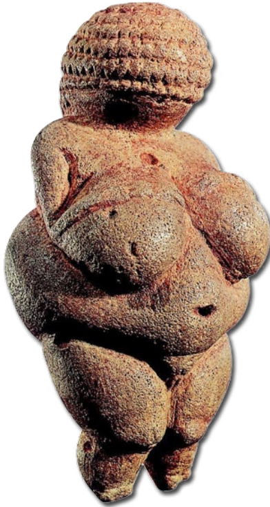
La « vénus » de Willendorf (vers -23 000)

exception : dans de nombreuses sociétés primitives, qu'on y vive de chasse ou d'agriculture, les femmes occupaient une place tout à fait estimée.