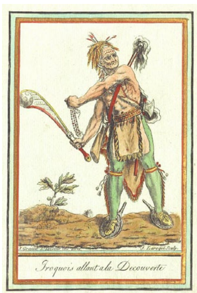
Un Iroquois, dans une représentation du XVIII e siècle

Les choses changèrent avec la publication en 1861 du Droit maternel , œuvre du juriste suisse Jakob Bachofen, qui eut un retentissement considérable. Bachofen reprenait l’idée que les Iroquois étaient l’image vivante du lointain passé des Grecs. Tout comme les Iroquois, de nombreux peuples barbares, desquels étaient issus les Grecs, reconnaissaient uniquement la filiation en ligne féminine. Jouant un rôle crucial en tant que mères, les femmes se trouvaient dans une position qui n’avait rien d’inférieure ou d’avilissante. Tout au contraire, elles étaient hautement considérées, tant dans la société que dans le panthéon : Bachofen était