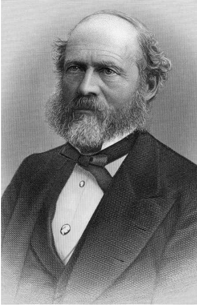
Henry Lewis Morgan (1818-1881)

l'histoire écrite et sur lesquels, à l'époque, on ne savait pour ainsi dire rien. Ils permettaient de vérifier que la méthode qu'eux-mêmes avaient forgée pour comprendre les sociétés humaines s'appliquait tout aussi bien à ces époques reculées qu'aux temps modernes. Cette méthode, le matérialisme historique, consistait à rechercher les causes les plus profondes de l'évolution des sociétés non dans les idées ou les mentalités des hommes, phénomènes qui devaient eux-mêmes être expliqués, mais dans leurs conditions matérielles d'existence.