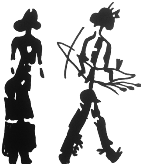
Gravure du Levant espagnol (- 5 000 ?) Toutes les traces archéologiques confirment le monopole des hommes sur les armes.

Contrairement à ce que l'on croit souvent, il n'est pas si facile d'expliquer pourquoi il en est ainsi. Toutes les raisons « naturelles » que l'on invoque généralement (mobilité réduite due à la maternité, nécessité de protéger les femmes en raison