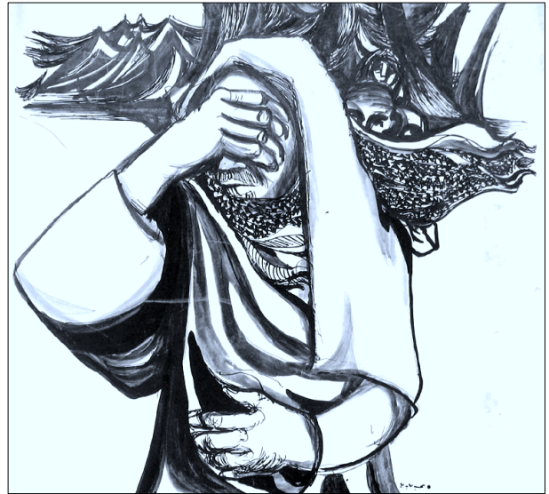
איור: עבד עאבדי

ביום שבו נמגר את האינתיפאדה, ביום שבו נצליח לפצץ אותה כליל, תשתרר ביהודה, שומרון ובחבל עזה דממה ארפה, חנוקה, דממת מות; והעיט יחוג מעל ההרים, יריח נורא יעלה מן הכפרים, מן הקברים. ומי שישרדו בחיים יהיו ספונים בשרידי בתייהם הפצועים, שותקים, פגועים. שועלים יהלכו בין הקרבות, ואנחנו נדע: הצלחנו. נצחנו. מגרנו עם. פצפצנו עם. ואנחנו נעמד על הדם ועל עיי הבתים ההרוסים, ונסתיר פנינו ממבטם. ואנחנו נהיה המובסים.