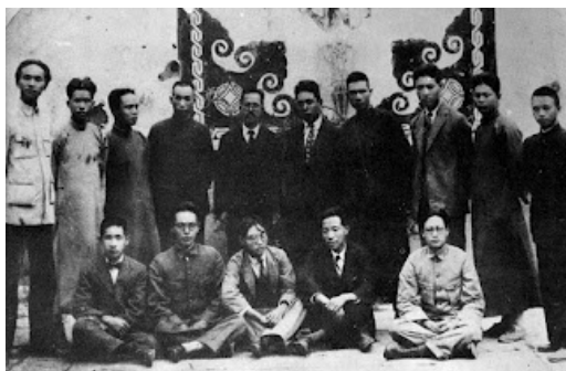
China, 1927: anarquistas coreanos e chineses