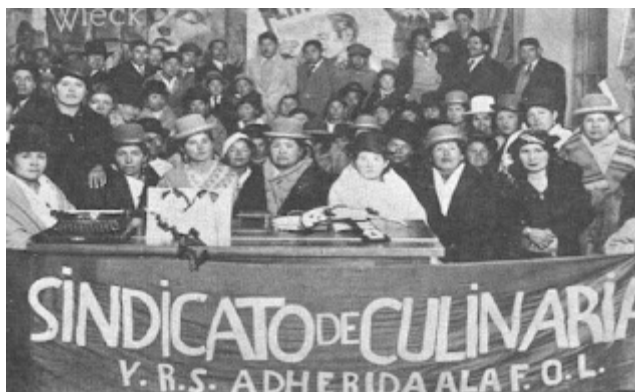
Bolívia, 1935: Sindicato de Culinária, anarco-sindicalista

Observando países como Argentina, Chile, França, Peru, México, Portugal, Uruguai, a Holanda e o Brasil por um período, nota-se que em todos esses países, os anarquistas constituíram a força predominante nos sindicatos.