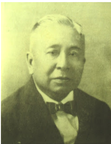
Isabelo de los Reyes, influenciado pelo anarquismo

Além disso, em muitos casos, os anarquistas e sindicalistas criaram sindicatos em países coloniais ou pós-coloniais – os quais estiveram sob o jugo direto do colonialismo ou, de alguma maneira menos formal, sujeitos aos grandes poderes. Observando esses países, podemos notar o padrão de um importante pioneirismo e de