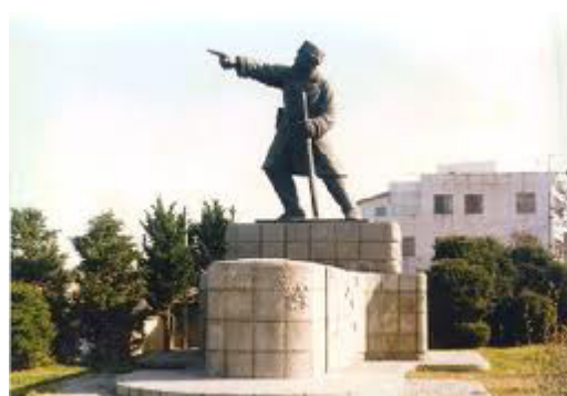
Memorial de homenagem a Kim Jwa-Jin, Coréia do Sul

Kim Jwa-Jin foi assassinado em 1931 por um comunista e, logo depois, as forças japonesas vieram do sul e acabaram com tudo; ele é chamado de “Makhno coreano”,