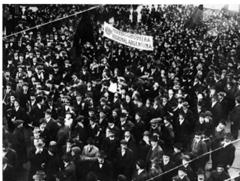
Sindicato anarquista de massas: Federación Obrera Regional Argentina

Ao observar vários outros critérios – a presença de periódicos diários, de vastas redes de escolas, a formação de exércitos de trabalhadores, os levantes revolucionários, o impacto na cultura das classes populares, o papel dos anarquistas e sindicalistas nos campos e nas lutas anticoloniais – podemos sustentar o mesmo argumento: o anarquismo e o sindicalismo de intenção revolucionária foram muito grandes na Espanha, mas esse caso não constitui uma exceção; devemos compreender o anarquismo e o sindicalismo de intenção revolucionária globalmente e, como um movimento global, entender o seu papel histórico.