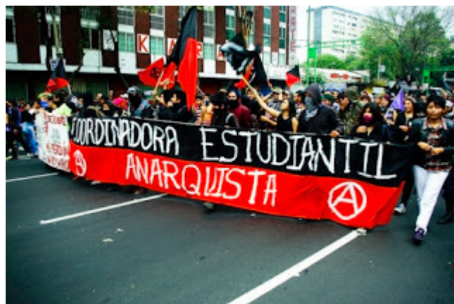
Anarquistas hoje no México: uma força importante

É muito importante entendermos que o anarquismo foi um movimento muito relevante. A predominância do marxismo nos movimentos de esquerda e nos círculos operários, em muitos países, só foi alcançada nos anos 1940. Foi apenas durante a Segunda Guerra Mundial que os partidos