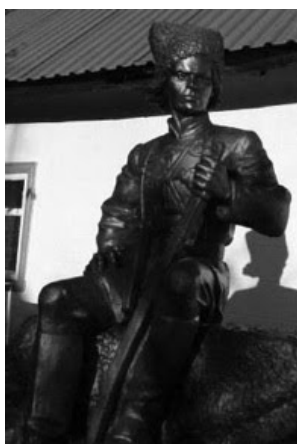
Estátua de Nestor Makhno, Ucrânia

Há também, é claro, o caso da Espanha, de 1936.