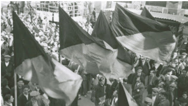
Anarquismo e sindicalismo de intenção revolucionária espanhola: poderoso, mas não único

Existe uma vasta bibliografia que aborda a questão: “Por que os anarquistas foram fortes na Espanha?” Há diversas respostas. O “bom” marxista argumenta que a Espanha tinha uma economia atrasada e que o anarquismo reflete as sociedades atrasadas; a Confederación Nacional del Trabajo (CNT) seria, dessa maneira, o resultado da interação entre esses dois fatores. Há também o argumento que enfatiza características nacionais, sustentando que os latinos são, em geral, vigorosos, e os anarquistas mais ainda; a CNT constituiria o resultado dessa interação.