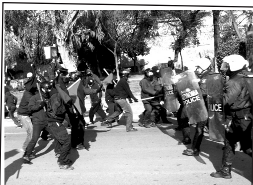
Καβάλα, 29 Γενάρη 2011.

Επίθεση από συντρόφους και συντρόφισσες σε φασιστική συγκέντρωση για τα Ίμια.