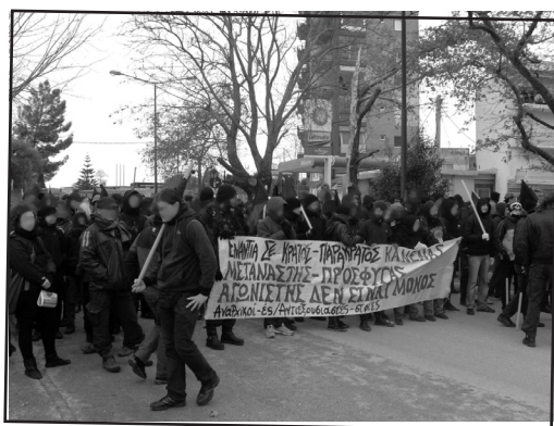
Πορεία Ηγουμενίτσα, 29/01/2011. Απόσπασμα από την αφίσα που καλούσε στην πορεία: “Η αλληλεγγύη στους μετανάστες και τους πρόσφυγες είναι αγώνας ενάντια στον εκφασισμό της κοινωνίας, ενάντια στο κράτος και στο κεφάλαιο...”