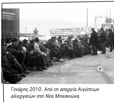
Γενάρης 2010. Από τη απεργία Αιγύπτια αλιεργατών στη Νέα Μηχανιώνα.

Οι μετανάστες παρόλο το διάχυτο ρατσισμό, παρόλη την καταστολή της αστυνομίας, παρόλη τη στυγνή εκμετάλλευση από τ' αφεντικά αγωνίζονται όλα αυτά τα χρόνια για βελτίωση των συνθηκών ζωής και εργασίας. Ήταν το σωματείο οικοδόμων «ο πολυεθνικός εργάτης» που δημιουργήθηκε στην Ικαρία το 2002 και το γεγονός ότι έπειτα από λίγους μήνες φασισταριά πραγματοποιήσαν επιθέσεις σε σπίτια μεταναστών. Ήταν οι αγώνες και οι απεργίες που πραγματοποίησαν μέσα στα εργοτάξια των ολυμπιακών εγκαταστάσεων το 2004 , όταν το ξεπουλημένο συνδικάτο οικοδόμων μίλαγε