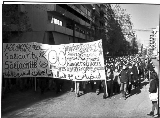
12 Φλεβάρη 2011, πορεία στην Πατισίων

Μετά τις πιέσεις του πρύτανη Πελεgrίνη, την κατάλυση του ασύλου και την επαπειλούμενη εισβολή από την αστυνομία, οι μετανάστες εκδιώχθηκαν από εκεί στις τρεις τα ξημερώματα και στοιβάχτηκαν σε ένα κτήριο στην οδό Ηλείου & Πατισίων. Παρόλες τις δυσκολίες (πολλοί μένουν παρά το κρύο και τις βροχοπτώσεις σε σκηνές στην αυλή του κτιρίου) συνεχίζουν με ψηλά το κεφάλι την απεργία πείνας.