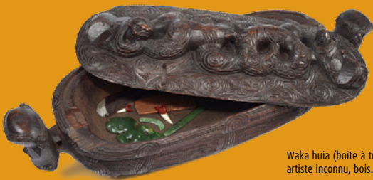
Waka huiia (boîte à trésors), 1500-1800, artiste inconnu, bois. Te Papa (OL000003)

Bienvenue au Te Papa, le musée national de la Nouvelle-Zélande.