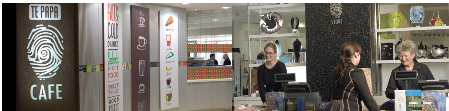
Te Papa Store