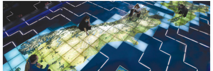
The Map, OurSpace

Visitez OurSpace, un espace interactif où vous pouvez donner libre cours à votre créativité. The Map prend vie sous vos pas et vos images s'animent sur The Wall. Embarquez ensuite à bord de nos simulateurs de mouvement The Deep Ride* ou The High Ride* pour une expérience exaltante. *Activités payantes. Niveau 2.