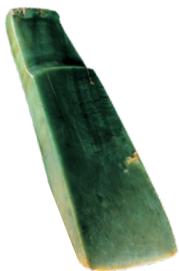
Toki pounamu (lame d'herminette en néphrite), 1300-1500, iwi (tribu) inconnu

Découvrez OurSpace , un espace interactif qui explore l'identité de la Nouvelle-Zélande à travers des activités divertissantes : The Map , The Wall et les simulateurs de mouvement The High Ride et The Deep Ride .