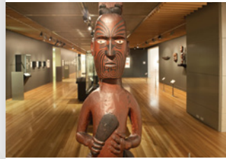
Poutokomanawa (pilier central sculpté), iwi (tribu) inconnu