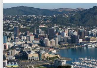
Panorama sur Wellington