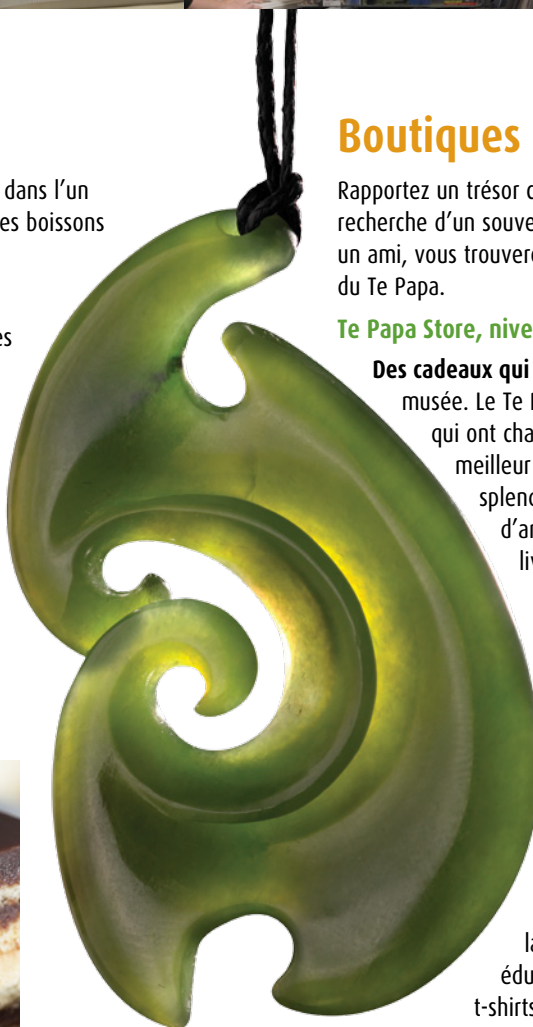
Pendentif (pounamu taillé), Hepi Maxwell

Divertissants et pédagogiques à la fois, les jouets et cadeaux du Kid's Store combleront les enfants de tout âge. Vous y trouverez de superbes livres sur le thème de la Nouvelle-Zélande, des puzzles éducatifs, des kits scientifiques, des t-shirts et le calmar colossal en peluche le plus adorable au monde.