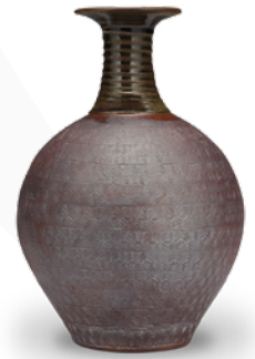
Jarre, 1976-79, Peter Stichbury