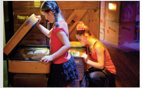
Blood, Earth, Fire