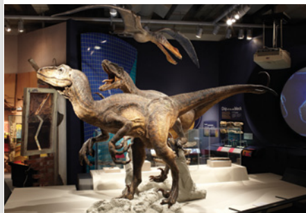
Images ci-dessus (de haut en bas) : The High Ride, OurSpace Le calmar colossal, Mountains to Sea The Map, OurSpace Dinosaures, Awesome Forces