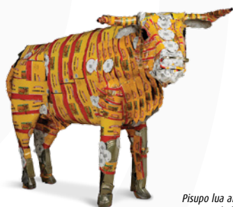
Pisupo lua afe (corned-beef 2000), 1994, Michel Tuffery