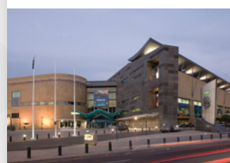
Façade du musée

Images ci-dessous (de haut en bas) : Le marae Tangata o le Moana