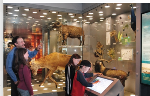
Blood, Earth, Fire