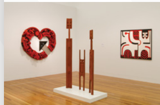
Trois œuvres de l'artiste Paratene Matchitt

Le café Level 4 Espresso se situe au cœur du musée. Vous pourrez vous y restaurer dans une atmosphère reposante.