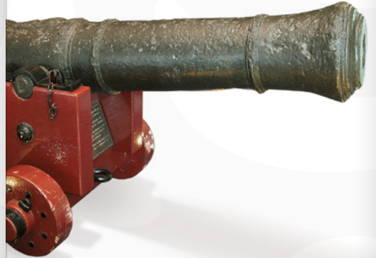
Canon de l'Endeavour approx. 1750-60, Joseph Christopher