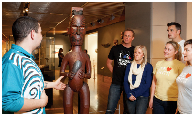
Visite guidée du Te Papa

Envie d'en apprendre plus ? Optez pour l'une de nos visites de groupe guidées, ou contactez-nous pour concevoir une visite sur mesure en fonction de vos centres d'intérêt et de vos besoins. Pour réserver ou obtenir plus de renseignements, contactez-nous par téléphone au +64 (0)4 381 7111 ou par e-mail tours@tepapa.govt.nz