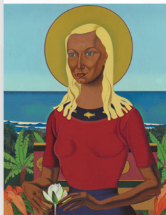
Rutu, 1951, Rita Angus