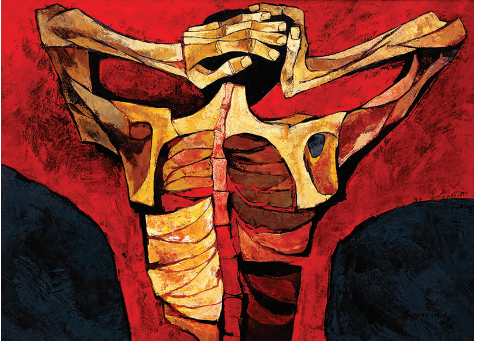
Rivers of Blood I and II, 1976 Ríos de Sangre I y II, 1976

...En las entrañas de mi patria entraba la punta asesina hiriendo las tierras sagradas. La sangre quemante caía de silencio en silencio, abajo, hacia donde está la semilla esperando la primavera. Más hondo caía esta sangre. Hacia las raíces caía. Hacia los muertos caía. Hacia los que iban a nacer.