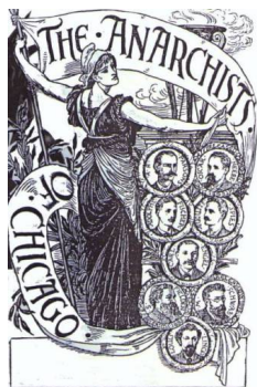
8 האנרכיסטים משיקגו

על רקע המשבר הקפיטליסטי הבינלאומי וניסיונותיהם של בעלי ההון לגלגל את ההפסדים שלהם על העובדים בצורת מדיניות צנע, התחדש המאבק האנטי-קפיטליסטי העולמי ותפס תאוצה. בספרד, יוון ומקומות נוספים, מאות אלפים יצאו לרחובות. עם ההתעוררות ברחוב הערבי ב"אביב הערבי", המונים נאבקו לא רק כנגד המשטרים הפוליטיים המדכאים אותם אלא גם כנגד השיטה הכלכלית שמשרתת את האליטות שבשלטון. מתוך המאבקים הללו, קמו תנועות אנרכיסטיות במצרים, תוניסיה, לבנון, ירדן וסוריה, הממשיכות במאבק גם כיום. בינתיים אצלנו, קמה המחאה החברתית הגדולה ביותר שידעה ישראל.