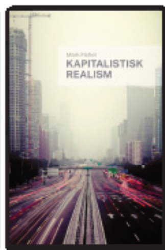
Kapitalistisk realism Mark Fisher ISBN 978-91-8676-37-7 Stöckl, 208