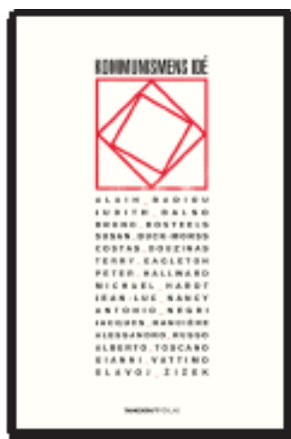
Kommunismens idé Alain Badiou m.fl. ISBN 978-91-8676-37-8 Stöckl, 268