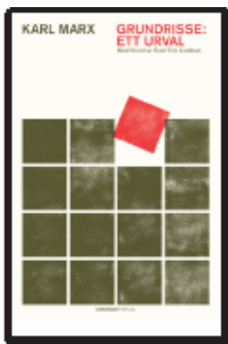
Grundrisse Karl Marx ISBN 978-91-8676-38-9 Stöckl, 248