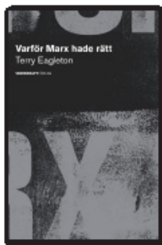
Varför Marx hade rätt Terry Eagleton ISBN 978-91-8676-38-6 Stöckl, 128