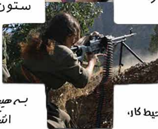
طرح روی جلد: گروه هنری عصیان

به هیچ جناح، هیچ نهاد، هیچ انتخاباتی اعتماد نکن!