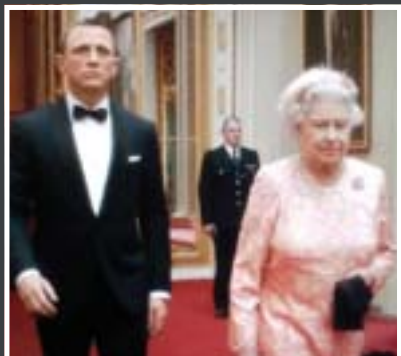
MISIÓN. Bond custodió a la reina en la inauguración de los Juegos Olímpicos

Entre las cosas que le ha permitido Bond se encuentra la de haber actuado al lado de la reina de Inglaterra, para la apertura de los pasados Juegos Olímpicos. "Fue algo increíble, que me puso el corazón a mil. Fue un poco raro que de pronto me encontrara en un