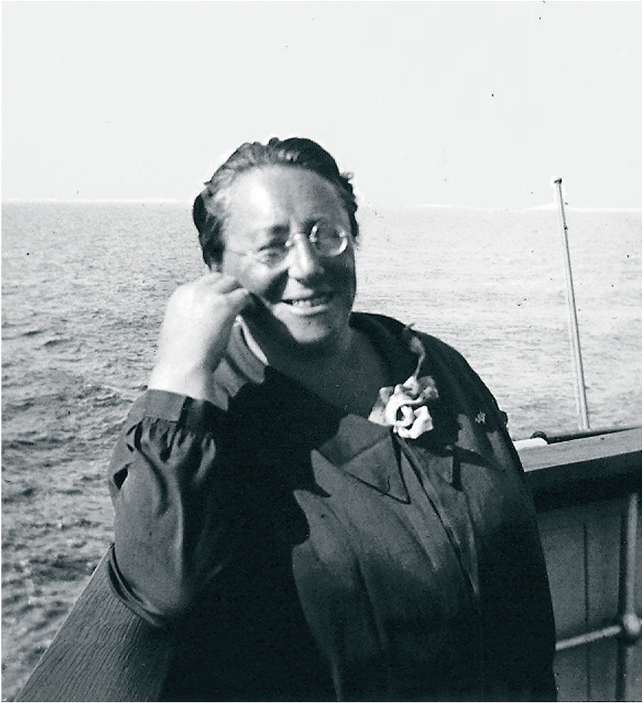
Emmy Noether 1882 - 1935