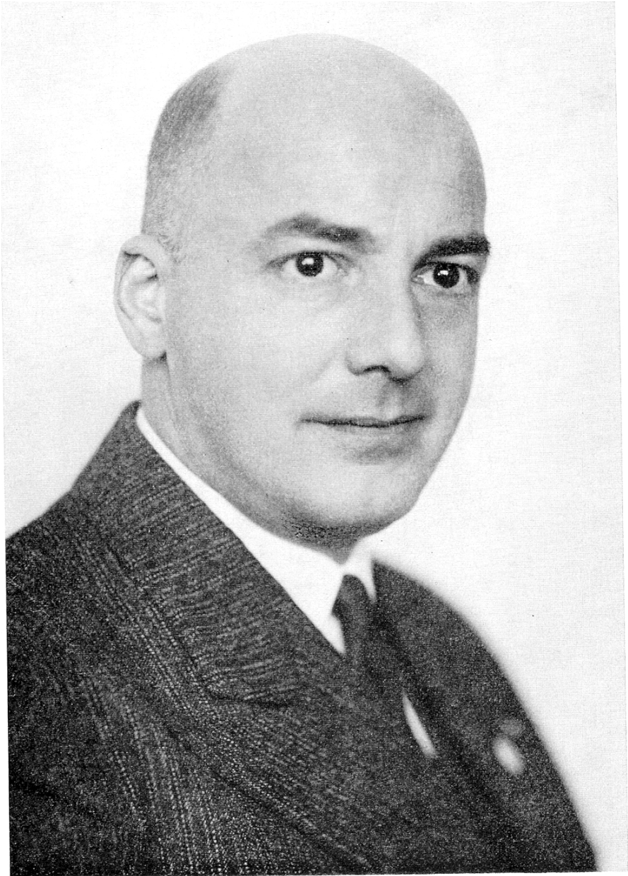
Helmut Hasse 1898 - 1979