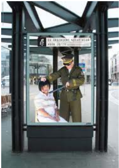
മാക്കിത്തീർക്കുന്നതിനും മനുഷ്യാവകാശങ്ങളെക്കുറിച്ചുള്ള ശരിയായ ബോധം പുരോഗമനവാദികൾക്കെല്ലാം ഉണ്ടായിരിക്കണം.

വിദൂരഭൂതകാലത്തിൽ നിലയുറപ്പിക്കാനോ അതിനുസമാനമായ സാഹചര്യം സൃഷ്ടിച്ചെടുക്കാനോ തികച്ചും അയുക്തികമായി ആഗ്രഹിക്കുന്ന ശക്തികൾ നമുക്കിടയിൽ അനവധിയാണ്. മതങ്ങളുടെ, കക്ഷിരാഷ്ട്രീയത്തിന്റെ ഉത്തരാധുനികതപോലുള്ള അസംബന്ധ സംജ്ഞകളുടെയെല്ലാം വേഷാലങ്കാരങ്ങളോടെ അവ നവോത്ഥാന പ്രസ്ഥാനത്തിന്റെ ഉത്തമമായ സംഭാവനകളെയെല്ലാം അപഹസിക്കാനും നശിപ്പിക്കാനും അതുവഴി ഭാവി കനത്ത അന്ധകാരത്തിന്റേ താക്കി മാറ്റാനും ശക്തിയും ആകും വിധമെല്ലാം ശ്രമിച്ചുകൊണ്ടിരിക്കുന്ന അവസ്ഥയാണ്. മുഴുവൻ ശക്തിയും സാധ്യതകളും സംരക്ഷിക്കാനും വിപുലപ്പെടുത്താനും തയ്യാറായില്ലെങ്കിൽ മദ്ധ്യകാല യൂറോപ്പിന്റേതായി നാം വായിച്ചറിഞ്ഞ അന്ധതയേക്കാൾ കഠിനവും ക്രൂരവുമായ ഒരു കാലഘട്ടത്തിലേക്ക് നാം വഴുതിവീണുപോയേക്കാം. സമഗ്രാധിപത്യത്തിന്റെ കെടുതികളിൽ നിന്നും ജനങ്ങളെ മോചിപ്പിക്കുന്നതിനും ഫാസിസത്തിന്റെ പൂർണ്ണവും നഗ്നവുമായ രംഗപ്രവേശം അസാധ്യ