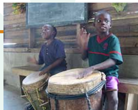
Danza y tambores de la comunidad de Batalla, de Grupo indígena garífuna, una mezcla de descendientes de esclavos africanos y de pueblos indígenas locales (La Alianza La Ruta Moskitia)

El temor y la distancia entre los partícipes... es decir no había un real protagonismo de los científicos en la elaboración de normas concretas que pusieran en marcha el cumplimiento del Convenio por eso muchos de ellos lo venían como un engorro a sus tareas, como un impedimento al desenvolvimiento de su