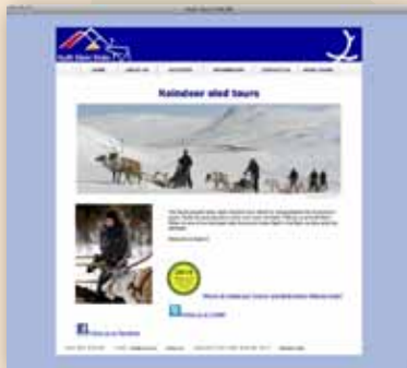
Ganador por juzgado del Premio ITBW 2010

Al poner en relieve los mejores servicios de turismo operados por comunidades indígenas y locales, la Secretaría del CDB ayuda a motivar a los operadores de todo el mundo para mejorar su comunicación en línea sobre la diversidad biológica y cultural, destacando las buenas prácticas en la gestión de turismo y para elevar la sensibilización de los operadores y del público sobre la diversidad biológica ..”