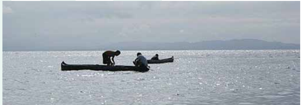
Indígenas Kunas pescando, Kuna Yala, Panamá (Hortencia Hidalgo Cáceres)

este número ustedes descubrirán, desde la visión de las comunidades indígenas y locales, lo que se realiza en América Latina y el Caribe, desde sus iniciativas y experiencias en la implementación del Artículo 8 (j) y otros artículos del Convenio sobre la Diversidad Biológica (CDB). Estas comunidades son una inspiración para otras iniciativas en nuestros esfuerzos mutuos para salvar la diversidad biológica de la Tierra y celebrar 2010, el Año Internacional de la Diversidad Biológica y su año hermano - el Año Internacional del Acercamiento de las Culturas. Las historias en éste número nos llevan por un viaje hacia la décima reunión de la Conferencia de las Partes del Convenio (COP-10), que se celebrará en Nagoya, Japón, en octubre de 2010, y más allá.