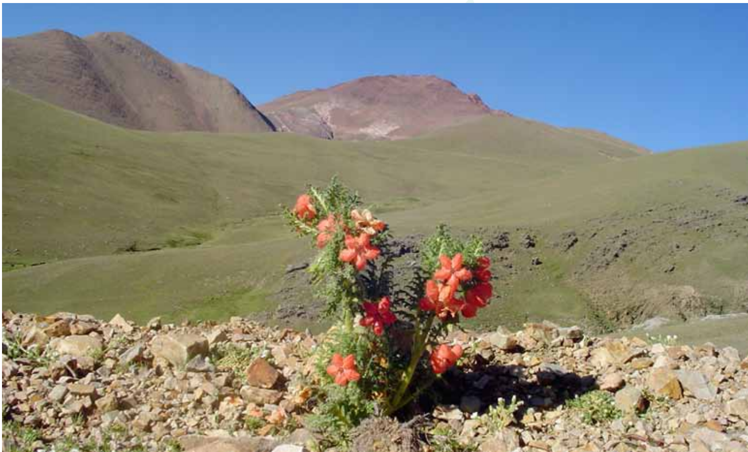
Flor de la región andina de América del Sur (Cesar A. Palacios)

se podría decir, es el de mayor experiencia al haber promulgado una Ley de Protección de CT vinculados con los Recursos Biológicos (No. 27811), así como los avances constitucionales en cuanto a biodiversidad y conocimientos tradicionales en el Ecuador y Bolivia. Otro aspecto positivo es que, los 4 países andinos tienen de alguna manera un norte o guía y unas políticas macro por las que deben orientarse para negociaciones de contrato de acceso con los países usuarios.