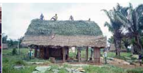
Contruyendo una casa "pahuichi" en la Comunidad Indígena Galilea, Rio Beni, Bolivia (Johannes Stahl)