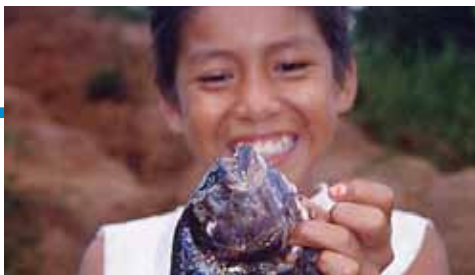
Acerca de la foto: Joven de la Comunidad Galilea, Pueblo Indígena Cavineño Río Beni, Bolivia

toda la región de América Latina y el Caribe, en donde participara, 20 personas entre hombres y mujeres y también se tomara en cuenta la nueva generación. Finalmente un taller Latinoamericana, que también concluirá con la participación en la COP10 en Nagoya, Japón.