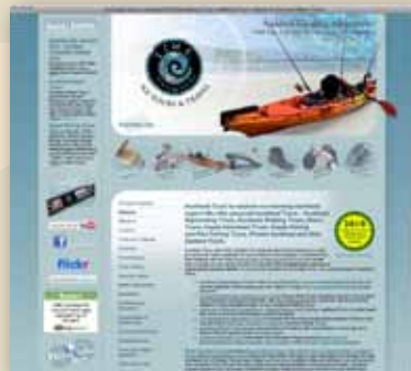
Ganador por voto popular del Premio ITBW 2010