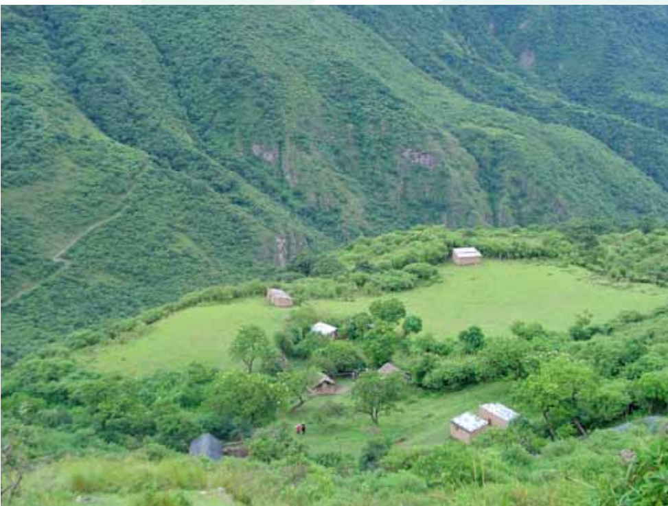
Comunidad Indígena Kolla Tinkunaku en la Yungas, entre Salta y Jujuy (Argentina), declarada Reserva de la Biosfera por la UNESCO (Cesar A. Palacios)

con una política y una norma regional de control, así como con leyes nacionales para regular el acceso a los RG. El caso peruano