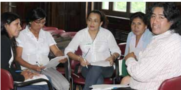
Taller de creación de capacidad para comunidades indígenas y locales de Latinoamérica y el Caribe sobre el CDB incluyendo el artículo 8(J) y acceso y participación en los beneficios. Tercer taller: región cono sur, realizado en Buenos Aires, del 4 al 6 de Febrero de 2010

La Secretaría también está trabajando con las Naciones Unidas para la Educación, la Ciencia y la Cultura (UNESCO) y con las comunidades indígenas y locales para producir y distribuir carteles sobre la importancia de los