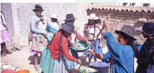
Mujeres Indígenas tiñendo lana con plantas, Calcha, Bolivia (Johannes Stahl)

El objetivo de la primera Buscar un asesoramiento de los representantes