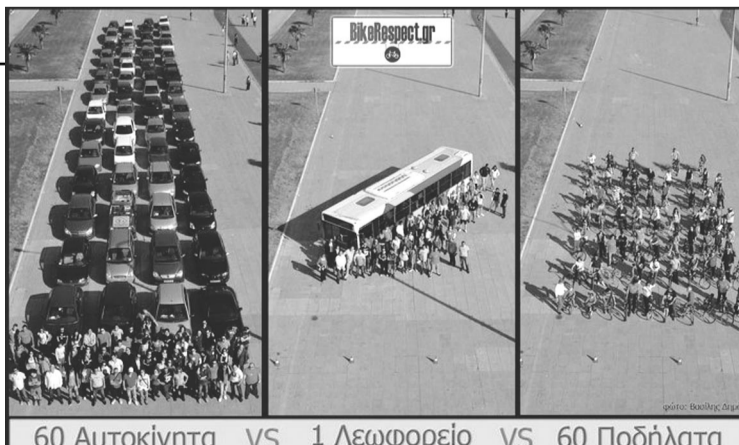
60 Αυτοκίνητα VS 1 Λεωφορείο VS 60 Ποδήλατα