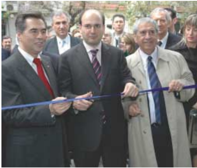
Η Τηλεματική, εγκαινιάζεται από τον Υπουργό Μεταφορών κ. Χατζηδάκη, τον Πρόεδρο του Ο.Α.Σ.Θ. κ. Παπαδόπουλο, τον Αντιπρόεδρο κ. Στεφανίδη και το Δήμαρχο Θεσ/νίκης.

Ο κος Χατζηδάκης, επισκέφθηκε το κτίριο Διοικήσεως του Ο.Α.Σ.Θ. στις 10 Απριλίου, προκειμένου να ενημερωθεί για τη λειτουργία της Τηλεματικής και να εγκαινιάσει τη λειτουργία των λεγόμενων «έξυπνων στάσεων» του Οργανισμού. Η επίσκεψη του Υπουργού, είχε σε κάθε περίπτωση, πανηγυρικό χαρακτήρα, αφού έγινε λίγο μετά από την ψήφιση από τη Βουλή του νόμου που αφορά την ανανέωση της Σύμβασης