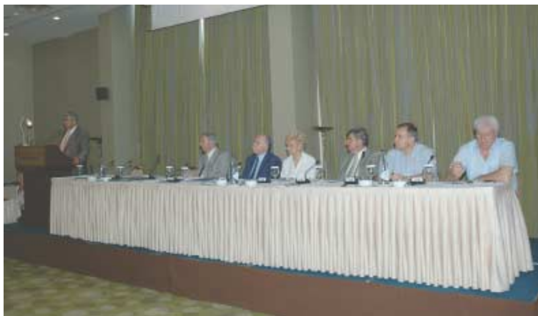
Ενώπιον της Γενικής Συνελεύσεως, αναλύθηκαν με λεπτομέρειες, όλα τα στοιχεία που αφορούν τον Οργανισμό, τις ευχάριστες εξελίξεις και τις προοπτικές του μέλλοντός του.