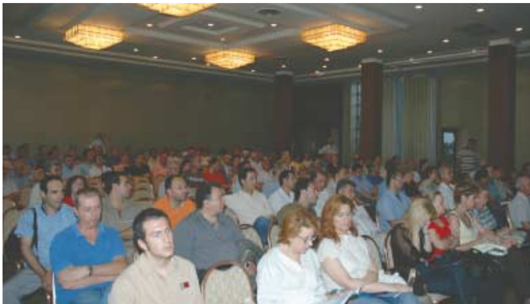
Μέσα σε μία κατάμεστη αίθουσα και με απόλυτη προσήλωση και προσοχή, το Σώμα των Μετόχων, παρακολούθησε τις εργασίες της Γενικής Συνέλευσης.

Η Γενική Συνέλευση, ενημερώθηκε διεξοδικά και σε βάθος από τον Πρόεδρο και τον Αντιπρόεδρο του Διοικητικού Συμβουλίου για όλα τα θέματα, ενώ κλήθηκε να αποφασίσει και να εγκρίνει την από 11.1.2008 οικονομική συμφωνία μεταξύ Ελληνικού Δημοσίου και