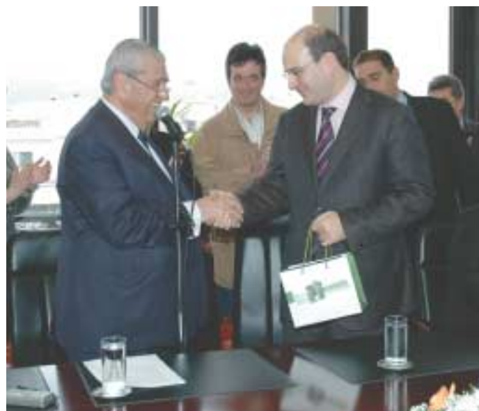
Ανταλλαγή θερμών λόγων, μεταξύ του Υπουργού κ. Χατζηδάκη και του Προέδρου του Οργανισμού κ. Χ. Παπαδόπουλου, κατά την επίσκεψή του στο κτίριο Διοικήσεως του Ο.Α.Σ.Θ.

Κατά τη διάρκεια της εκδήλωσης, παρουσιάστηκε η ταινία-ντοκυμανταίρ « Πενήντα Χρόνια Ο.Α.Σ.Θ. », που άφησε στους παρευρισκομένους, τη βαθιά εντύπωση ενός σπουδαίου παρελθόντος και τη βεβαιότητα ενός λαμπρού μέλλοντος για τον Οργανισμό Αστικών Συγκοινωνιών Θεσσαλονίκης.