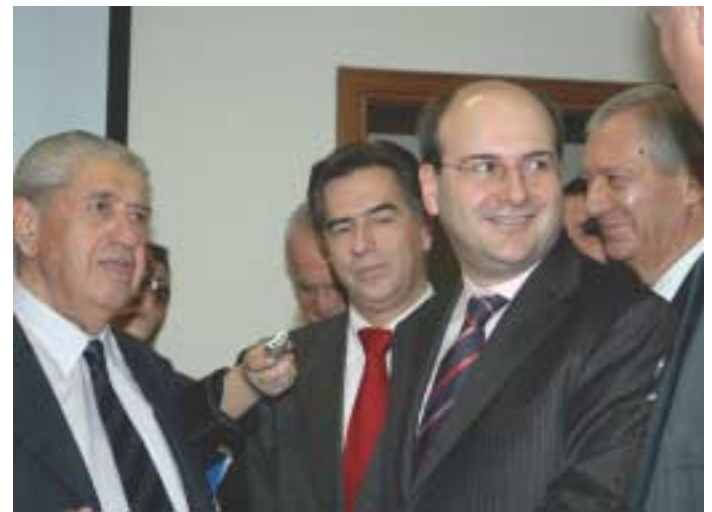
Έκδηλη η ικανοποίηση του Υπουργού από την ενημέρωσή του, στην αίθουσα Τηλεματικής. Μαζί του, οι Πρόεδρος και Αντιπρόεδρος του Ο.Α.Σ.Θ., ο Δήμαρχος και πλήθος υπηρεσιακών παραγόντων.

Ιδιαίτερα στάθηκε ο κος Χατζηδάκης στην προσφορά του Προέδρου και του Διοι-