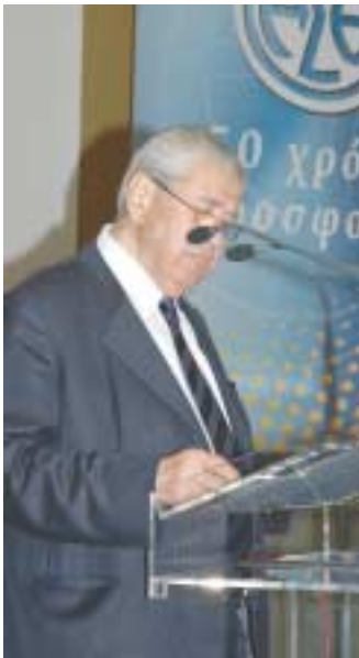
Ο Πρόεδρος του Οργανισμού κ. Χ. Παπαδόπουλος και ο Υπουργός Μεταφορών και Επικοινωνιών κ. Χατζηδάκης κατά την εκφώνηση των λόγων τους, στην εκδήλωση του Βελλιδείου.

Ακολουθώντας, ο Υπουργός μετέβη και πραγματοποίησε τα εγκαινία της πρώτης «έξυπνης στάσης» στην οδό Αγγελάκη και στη συνέχεια στο Βελλίδειο Συνεδριακό Κέντρο, όπου τον δεξιώθηκε και παρέθεσε επίσημο γεύμα, η Διοίκηση του Οργανισμού.