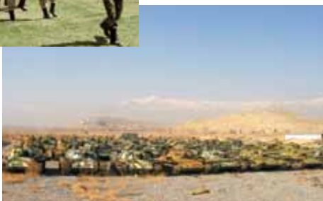
جمع آوری سلاح تحت پروگرام (DDR)

طی سال های متمادی جنگ سالاران اجازه مسلح نمودن افراد را داشتند. جاپان ابتکاری را برای ترویج برنامه دی دی آر که خلع سلاح، ملکی سازی و برگشت به زندگی عادی افراد مسلح سابق بود که تعداد شان به ۶۰,۰۰۰ میرسید به خرج داد. يك عملیاتی که در اوائل بسیار مشکل بود. در ماه جوزا سال ۱۳۸۵ موفقانه به اتمام رسید. در ماه می همان سال يك سروی نشان داد که به تعداد ۵,۰۱۰ عسکر به زنده گی ملکی رو آوردند. و برای ۹۰٪ شان زمینه کار فراهم گردید و ۹۲٪ آنها را کار و برگشت به زنده گی ملکی راضی بوده و ابراز خوشی نمودند. موضوع دیگر تسریع بخشیدن برنامه دایاک (انحلال گروپ های مسلح غیر قانونی) است که در این برنامه شامل دی دی آر نمی گردد. جاپان دومین کنفرانس توکیو را برای استحکام صلح در افغانستان برگزار نمود و با فرا خوانی کمک های جامعه جهانی برای برنامه دایاک، جاپان نقش مثبت را در این موضوع ایفا نمود.