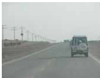
شاهراه جدید بین کابل و قندهار

در ماه سنبله سال ۱۳۸۱ بعد از بیانیه مشترک کشور های امریکا و جاپان، هر دو مملکت همکاری های شان را در قسمت بازسازی شاهراهی (سړک حلقوی) که شهرهای کابل، قندهار و هرات را با هم ارتباط میدهد اعلام داشتند. کشور جاپان بازسازی ۵۰ کیلومتر شاهراه قندهار کابل را عهده دار بود که مراسم افتتاح کار آن در سال ۱۳۸۲ برگزار گردید.