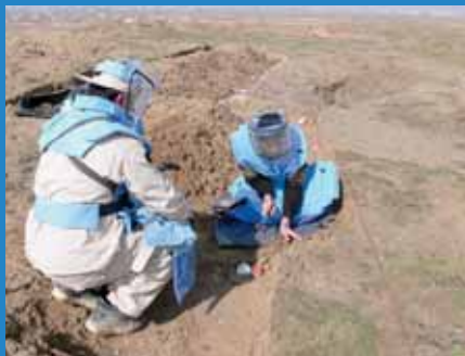
در حال از بین بردن ماین ها تحت JMAS

با مردم محل مصروف فعالیت هستند. این کمک ها تحت کمک های بلا عوض پروژه های جاپانی صورت می گیرد. بر علاوه با همکاری دولت جاپان یکی از این موسسات جاپانی JMAS در پروسه نظارت تیم بین المللی DDR کمک نموده که کار کرد این موسسات جاپانی توسط دولت افغانستان به دیده قدر نگرسته شده است.