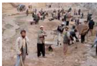
مسکونین در ولایت بامیان در تعمیر سرکها سهم میگیرند

بعد از سال ۱۳۸۱ تعدادی زیادی مهاجرین به افغانستان بازگشت نمودند که این يك موضوع مهمی در ساختار کشور به حساب میورد. جاپان به منظور تهیه سرپناه و انکشاف عمومی دهات و قریه جات در قسمت آبادی و تهیه مسکن موقتی، تامین زیر بنای ابتدایی، آب آشامیدنی، تعلیم و تربیه، کمکهای طبیی و غیره تحت نام "ابتکارات اوگاتا" همکاری های همه جانبه نموده است. تا ماه سنبله سال ۱۳۸۵ بیشتر از ۴.۶ میلیون مهاجر به کشور بازگشت