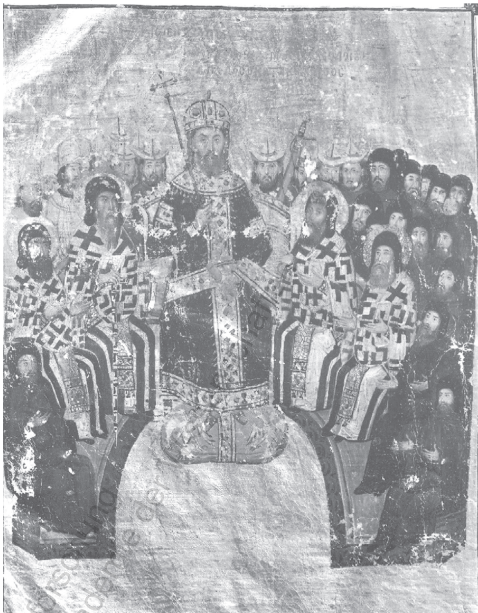
Abbildung 2: Kaiser Johannes VI. Kantakuzenos inmitten der Synode von 1351. Paris, Bibl. Nat., Ms. Grec. 1242, fol. 5v.

der aus Konstantinopel in diesen Sprengel übersiedelt war, beauftragt (das Protokoll dieser Befragung wurde schriftlich an die Synode übermittelt), einige Zeugen nochmals vorgeladen und auch frühere in das Register des Patriarchats eingetragene Versprechen des Kabasilas beigebracht (wahrscheinlich durch den »Hüter« des Registers, den Megas Chartophylax des Patriarchen). Am Ende dieses aufwendigen (und wie überhaupt das Procedere der Synode stark verschriftlichten) Verfahrens blieb aber das Urteil der Synode auch gegen alle Versuche der Beeinflussung bestehen.