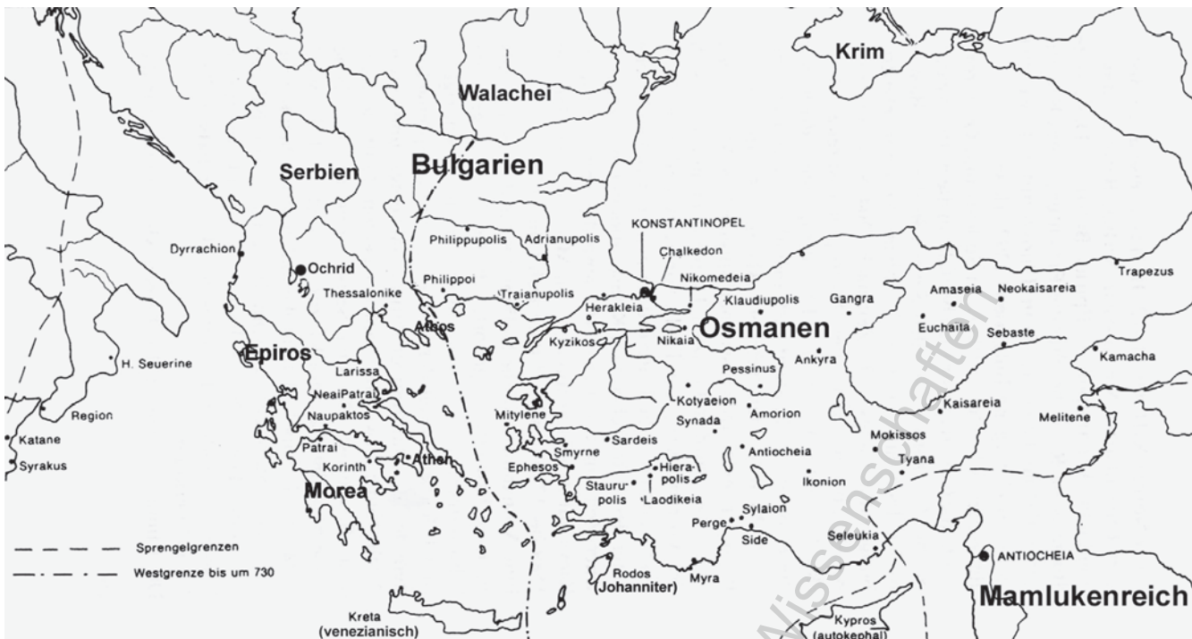
Abbildung 1: Der Sprengel des Patriarchats von Konstantinopel. Auf der Grundlage der Karte in: J. Koder, Der Lebensraum der Byzantiner. Historisch-geographischer Abriß ihres mittelalterlichen Staates im östlichen Mittelmeerraum (Byzantinische Geschichtsschreiber, Ergänzungsband 1), Nachdruck mit bibliographischen Nachträgen Wien 2001, 107.

synode und war nach der Novelle Nr. 137 des Kaisers Justinians von 565 von all jenen dem Patriarchat unterstehenden Oberhirten zu besuchen, denen keine Suffraganbischofe unterstanden und die somit ohne »eigene« Synode in ihren Provinzen waren. Ursprünglich war sie wie die Metropolitansynode zweimal im Jahr einzuberufen (im Juni oder September).