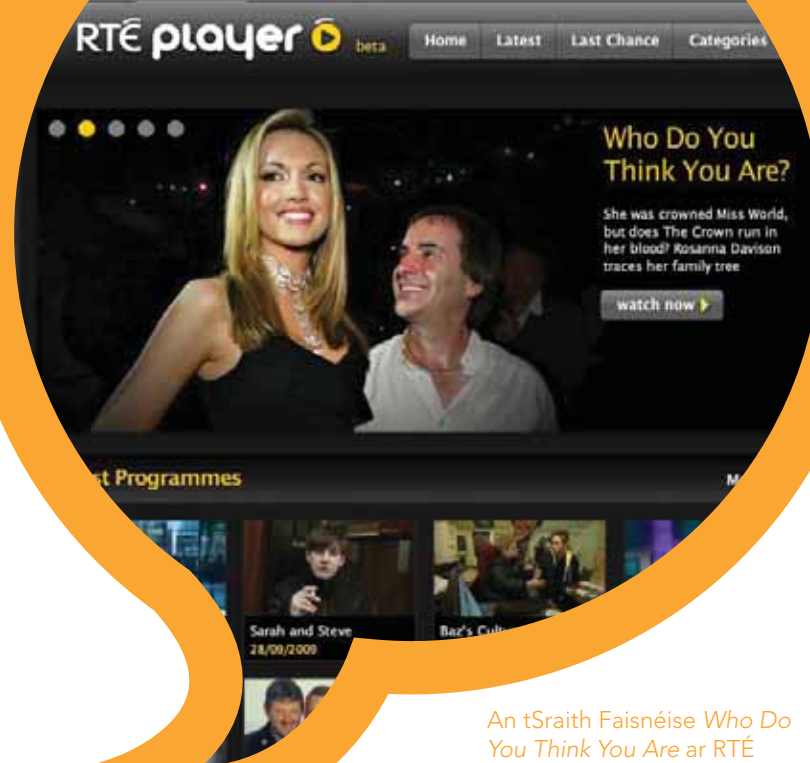
An tSraith Faisnéise Who Do You Think You Are ar RTÉ Player.

Forbraíodh RTÉ Player trí úsáid a bhaint as an teicneolaíocht chomhbhrúite físe MPEG 4 is déanaí agus seinnteoir físe Flash. Cinnteoidh sé sin go n-oirfidh sé sin an t-úsáideoir ar an gcaoi is fearr, go mbeidh rochtain go tapa aige agus caighdeán ard closamhairc idirlín.