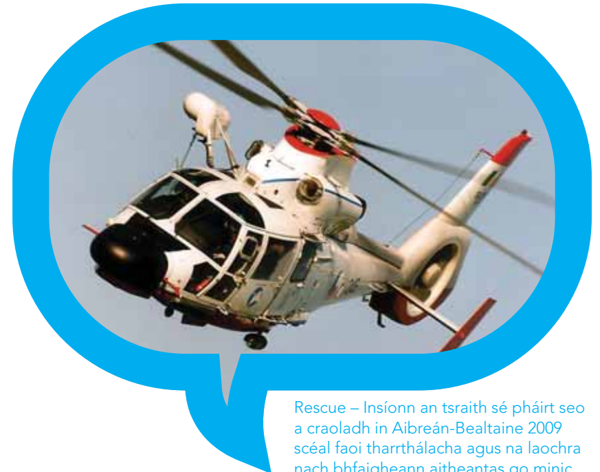
Rescue – Insíonn an tsraith sé pháirt seo a craoladh in Aibreán-Bealtaine 2009 scéal faoi tharrhálacha agus na laochra nach bhfaigheann aitheantas go minic.

👉 cliceáil anseo! www.rte.ie/commissioning