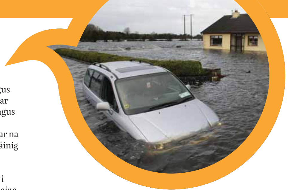
Léiríonn carr faoi uisce chomh dona agus a bhí na tuilte i gCo. na Gaillimhe.

Bhí freagracht shoiléir reachtúil ar RTÉ clúdach réigiúnach cuimsitheach a sholáthar. Go minic ní thuigtear fiúntas líonra réigiúnach den chineál sin go dtí go dtarlaíonn géarchéim mar a tharla i mí na Samhna 2009. Ba léiriú soiléir é caighdeán agus méid an chlúdaigh ar chomh láidir agus atá clúdach náisiúnta RTÉ agus an fíor-thiomantas atá ag foirne réigiúnacha RTÉ do na pobail áitiúla.