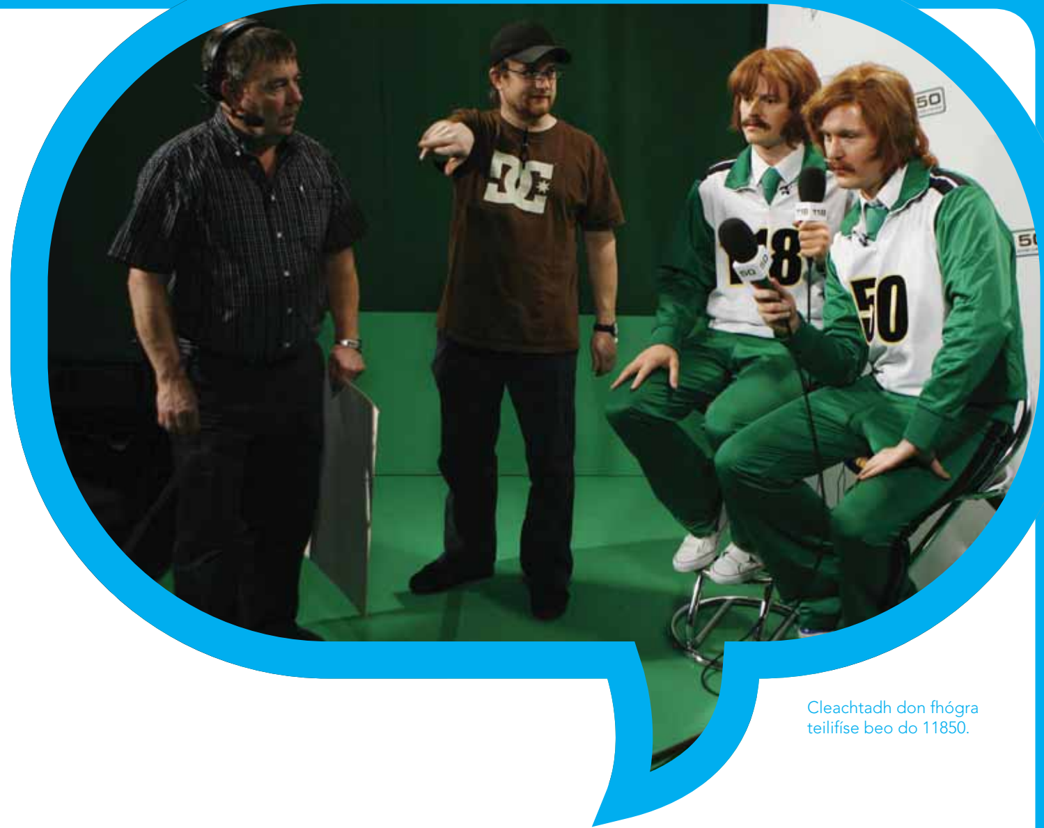
Cleachtadh don fhógra teilifíse beo do 11850.

De réir mar a fhorbraíonn agus a coinbhéiríonn teicneolaíochtaí digiteacha sna blianta amach romhainn beidh deiseanna ann d'fhógróirí agus d'urraithe a bheith i dteagmháil le lucht éisteachta/féachana. Leanfaidh RTÉ ag obair go dlúth lenár bpáirtithe fógraíochta agus gníomhaireachta chun forbairt a dhéanamh ar fheachtais chomhtháite a chuireann leis na deiseanna tráchtála agus cruthaitheacha a sholáthraíonn na teicneolaíochtaí nua sin.