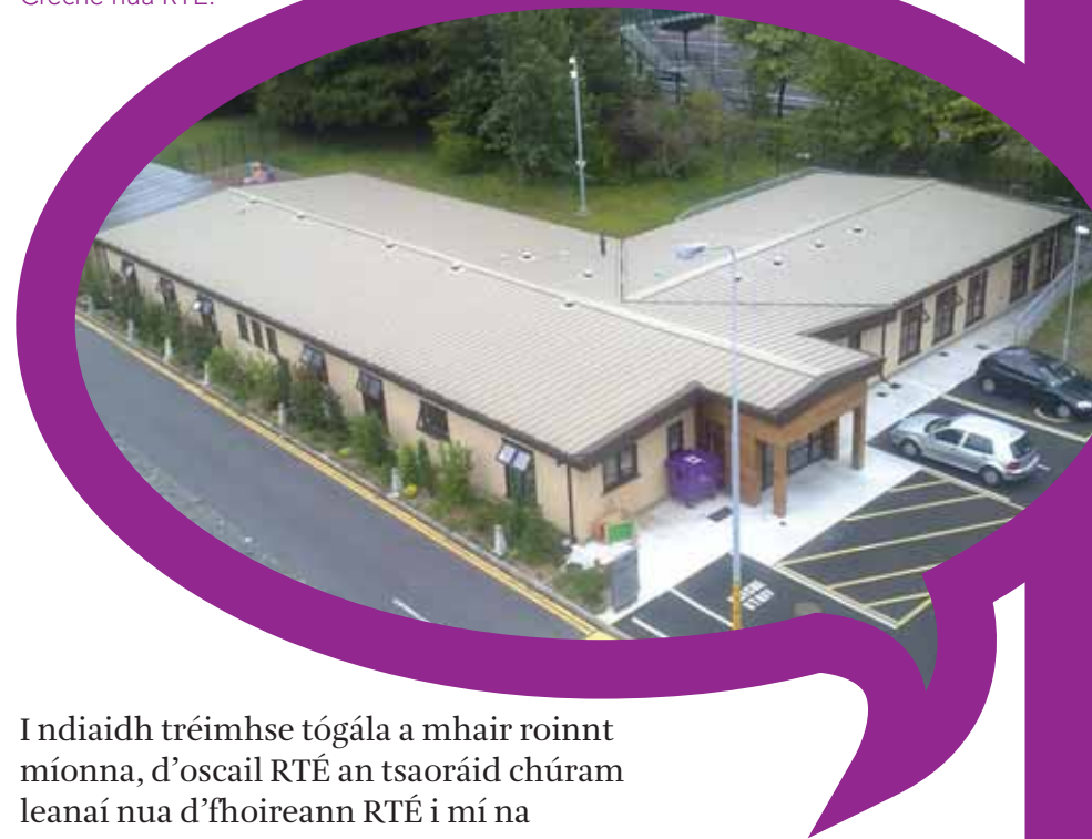
Radharc ón aer de Creche nua RTÉ.

I ndiaidh tréimhse tógála a mhair roinnt míonna, d'oscail RTÉ an tsaoráid chúram leanaí nua d'fhoireann RTÉ i mí na Samhna 2008. Saoráid shaintógtha atá sa tsaoráid nua chun an timpeallacht is fearr a chur ar fáil do leanaí agus tá sé in áit an fhoirgnimh creche réamhdhéanta bunaidh a bhí ann ó 1987. Tá an tsaoráid nua á bainistiú agWEE Care Day Nurseries agus táthar in ann cúram a sholáthar do suas le 73 leanbh idir trí mhí agus cúig bhliana d'aois ar bhonn lánaimseartha. Tá Coiste Stiúrtha Tuismitheoirí fós ann a chasann ar a chéile uair sa ráithe chun plé a dhéanamh ar shaincheisteanna nó ábhair imní a ardaíonn thuismitheoirí le bainistíocht an creche.