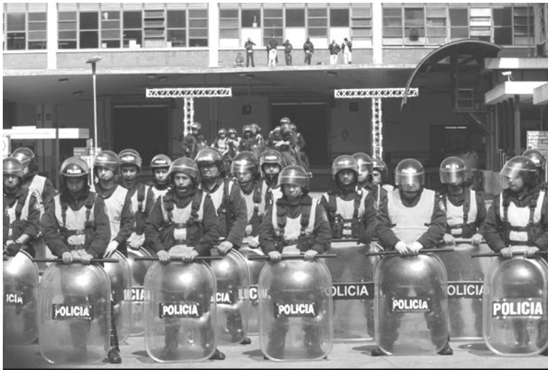
25/9/09 SE MILITARIZA LA FABRICA

Nosotros tenemos que tomar ACTUALIDAD iniciativas. Apuntamos a que se toque la producción para poder incluir lo de la reincorporación en un reclamo. Seguir cortando rutas es un camino de desgaste. Ahora tenemos en vista hacer un acto para los siete meses del inicio del conflicto, por eso apostamos a los compañeros de adentro. Estamos haciendo un esfuerzo muy grande para tratar de mantener esta pelea que va a ser muy larga, pero vamos a seguir acampando. Estamos con volantes en la puerta de la fábrica, hacemos choripaneada, venta de gaseosas, que a la vez es un autosostenimiento para seguir bancando. Tenemos apoyo de los compañeros adentro. En cualquier fábrica, cuando hay un conflicto, a los despedidos se les da la espalda, en cambio acá la gente no te quiere soltar la mano.