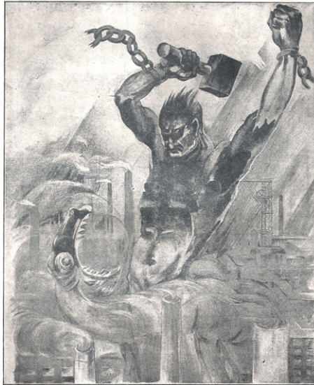
CARTEL DEL IV CONGRESO DE LA AIT EN 1930

Una de las imágenes más conmovedoras de las pintadas por Francisco de Goya, posee un sintético contenido, un perro ladrando en el vacío. Es posible que el célebre aragonés se sintiera así, ante el fracaso de la insurrección popular y la consolidación de la monarquía absoluta en su tierra ibérica. La sensación de impotencia ante el vacío existencial, la vacuidad y sin sentido que nos ofrece el sistema imperante, puede hallar reflejo aun en esa pintura de comienzos del siglo XIX.