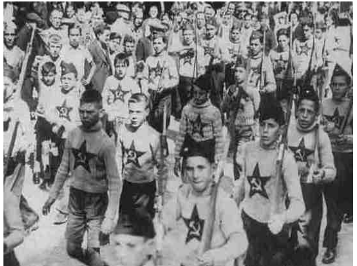
Niños "Comunistas" desfilando en Madrid 1937

Hasta hacen parecer que la izquierda política es revolucionaria o hay que aplaudirla por querer destituir a Fino Palacios. Sin embargo, es tan asqueroso el designamiento de este sujeto como también la crítica reformista que realizan estos tipos de partidos proleburgueses. ¿por qué asqueroso? Por que no critica la creación de un nuevo aparato represor si no que critican al verdugo designado. Con esto quiero demostrar, y reafirmar (como ya sabemos) que la izquierda no plantea eliminar las instituciones represivas si no cambiar al verdugo de turno. Esta institución represiva que hoy está en manos burguesas ya lo estuvo en su momento de bolcheviques que no