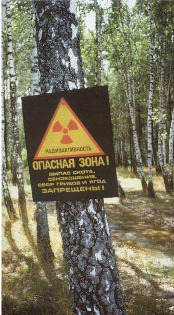
Bosque cercano a Chernobyl, "Peligro, zona contaminada, prohibido recoger bayas, setas y el pastoreo de animales"

¿No moriría mucha gente si el tecnosistema se desmantelase? Sí. Si de verdad te importan los números ten en cuenta que cuanto más se expanda la tecnología más aumentará la población y más probable y catastrófico será su colapso, si al final el sistema acaba colapsándose por sí mismo dentro de doscientos años morirá mucha más gente que si se colapsase ahora ya que la población seguirá creciendo.