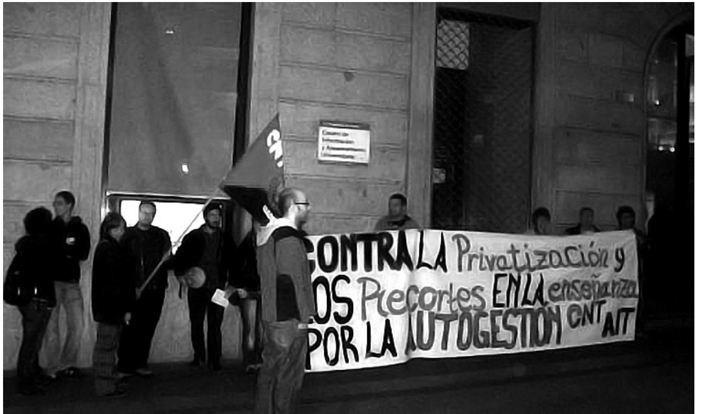
Concentración en la Consejería de Educación de la CAM para denunciar los recortes

b) Por las irregularidades detectadas en cuanto a la retribución y el número máximo de horas extraordinarias que llevan a cabo.