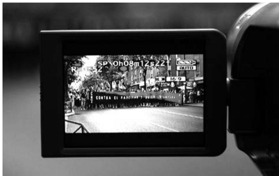
La Plataforma ha sido testigo de numerosas movilizaciones, especialmente en Madrid. En la imagen, la manifestación en Vallecas contra el fascismo organizada por la CNT en mayo de 2009.

A menudo, la represión que ejerce el poder se extiende a quienes intentan contar lo que ocurre, dando voz a lo que los medios burgueses callan o distorsionan. No obstante, nos sentimos tan acosadas o represaliadas como cualquier otro compañero de lucha. A pesar de ello, sabemos que contar con imágenes, en el formato que sea, acarrea una responsabilidad, por lo que solemos tomar ciertas medidas de seguridad, como intentar no sacar elementos que identifiquen a nuestras compañeras y compañeros salvo que se decida lo contrario en la asamblea que organiza, o poner el material a buen recaudo durante y después del acto; en definitiva tomamos precauciones respecto al material gráfico que conseguimos en cada acto.