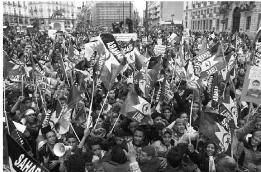
Manifestación pro saharauí en Madrid el 13 de noviembre