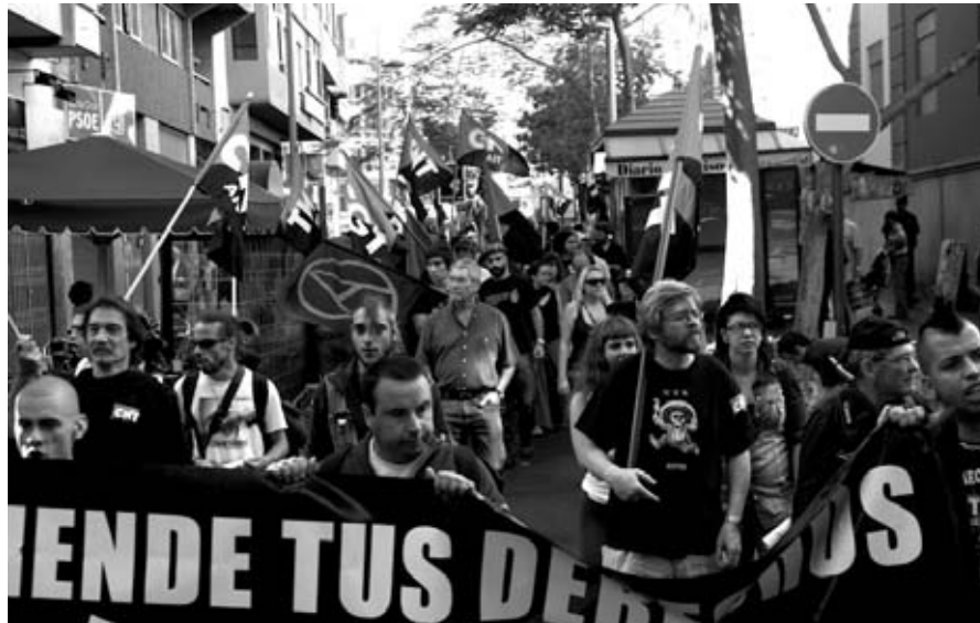
Manifestación de la FL de Tenerife el pasado 13 de noviembre

Córdoba: la CNT local salía a manifestarse el 9 de noviembre para protestar contra el Decreto 5/2010 aprobado por la Junta en julio, que representa el mayor intento de privatización de la administración y los servicios públicos hecho hasta ahora en España. Con este decreto, se crean las llamadas Agencias, que integran a todas las empresas públicas de la Junta y a gran parte de la administración común. Estas Agencias van a ser empresas, que en su gran mayoría van a funcionar con criterios empresariales y de acuerdo al derecho privado, no al derecho público. Esto supone la conversión de los servicios públicos en un negocio, gestionado no por trabajadores públicos, sino por el partido que esté en el poder y por tanto, sirviendo