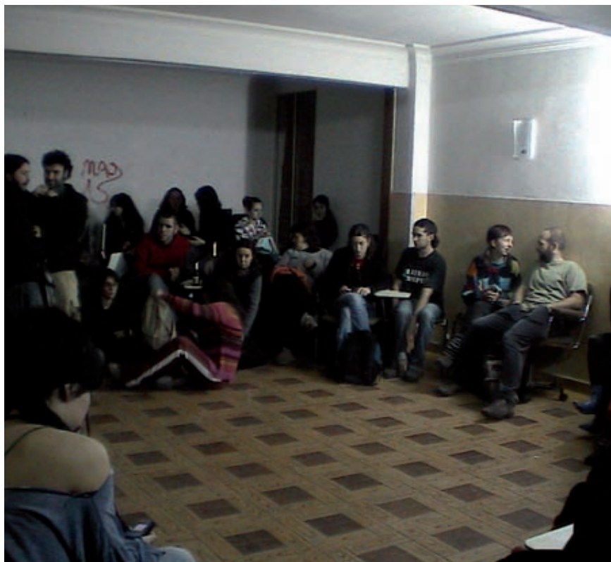
Imagen de una de las primeras asambleas de coordinación en Madrid

y obtener jugosas subvenciones en calidad de delegados sindicales es una constante, gracias al fragmentación de este sector en diferentes convenios. Fragmentación que a su vez dificulta la movilización de los trabajadores/as... Vergonzoso que un sector donde las empresas viven, en buena medida, de dinero público, esté así. No podemos dejar de señalar a la administración, local, autonómica y central, como responsable de este "desastre" laboral, porque lleva consintiéndolo muchos años y fomentando la contratación de empresas que cometen todo tipo de abusos con sus trabajadores/as.