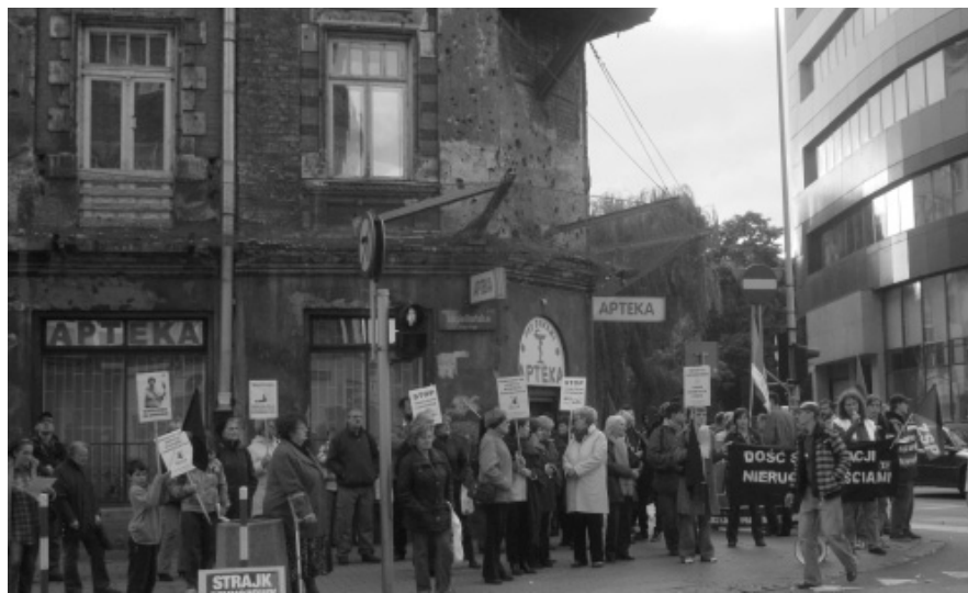
Piquete ante el primer edificio salvado de la privatización en Varsovia

“Los alquileres subieron entre un 200noviembre y un 300noviembre el último año. En algunos barrios entre un 40noviembre y un 60noviembre de vecinos se convirtieron en morosos, a los que ayuntamiento impone penalizaciones de hasta un 300noviembre” “sabemos que el cambio ha de venir de los movimientos populares desde abajo y no de los políticos”