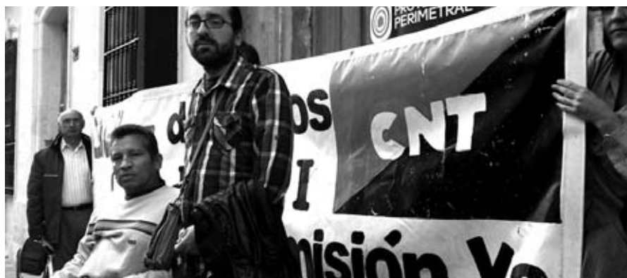
Piquete frente a las cocheras de los autobuses urbanos de leganés

Aunque el acuerdo es satisfactorio para el trabajador afectado no deja de sorprender que la Asociación Comarcal de Discapacitados Murgi no valore adecuadamente la opción de re-