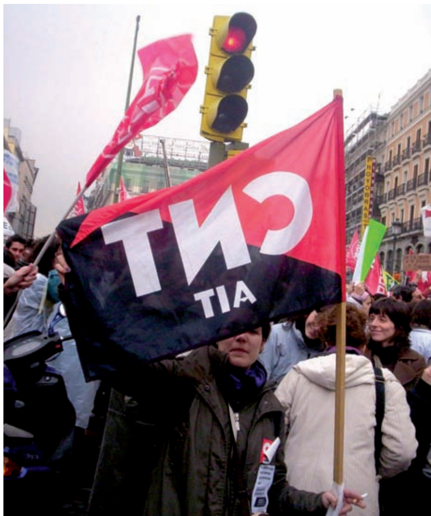
El paro del 11D supuso uno de los primeros intentos movilizadores del sector / CNT ENSEÑANZA

Esta asamblea se convirtió en un punto de referencia, realizando actividades, editando