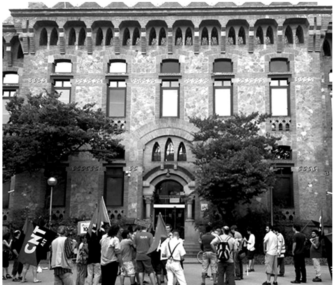
Concentración contra los despidos frente al Departamento de Salud de la Generalitat .

La Sección sindical de la CNT, ante la insólita situación, decidió abrir conflicto con la empresa, y -único sindicato que lo hizo-, presentando 13 denuncias judiciales, realizando numerosas concentraciones, asesorando a los compañeros despedidos, convocando una huelga, redactando comunicados de prensa, e incluso ocupando el Departamento de Salud. La iniciativa de la CNT recibió la colaboración de la sección de CGT, que presentó una denuncia por los mismos hechos ante Inspección de Trabajo y que hizo acto de presencia en algunas de las acciones convocadas. El resto de sindicatos (CCOO, UGT, y STC) quedaron completamente inactivos. A pesar de encontrarse con un 36,64% de la plantilla despedida, no solamente no realizaron acciones ni presentaron ninguna denuncia, sino que ni siquiera emitieron un solo comunicado ni para la prensa ni para la plantilla. Atento, por su parte, reconocía tímidamente el error cuando, saltándose la legislación en materia de bolsa de trabajo recogida en el convenio colectivo, no tuvo más remedio que volver a contratar a parte de la plantilla (negando todos los derechos adquiridos por antigüedad), con la intención de evitar que se siguieran perdiendo llamadas y que el escándalo llegara todavía