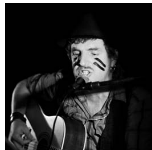
Cruz (Jalea Mental) en Plasencia