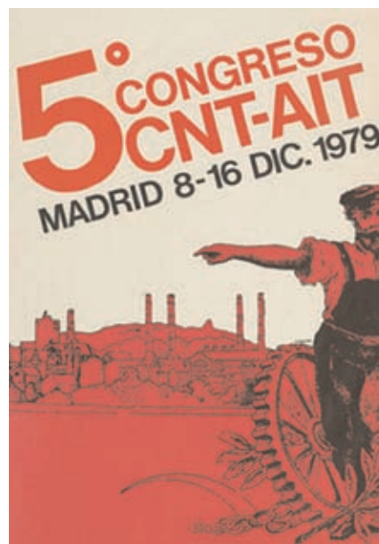
Cartel V Congreso Confederal CNT-AIT

rar el comunismo libertario cuanto antes. El congreso zaragozano de mayo de 1936 mostró que, a pesar de intentos insurreccionales fracasados, divergencias internas y represión poli-