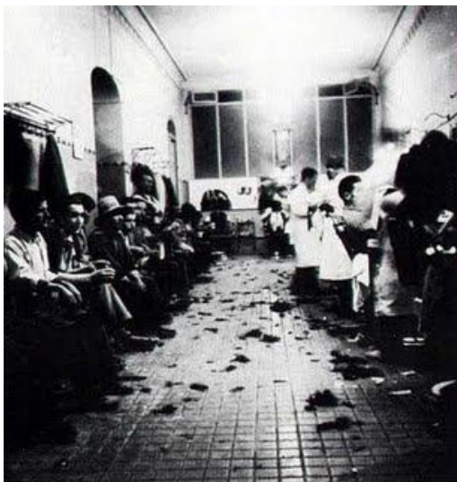
Imagen de una barbería colectivizada en Aragón, a principios de 1937

Antes de esa fecha, el día a día en la ciudad catalana transcurría con la tan habitual paz social, los patrones podían vivir del trabajo de sus empleados sin prácticamente trabajar. El obrero trabajaba en pésimas condiciones debido a la necesidad de la que era presa. El servicio consistía en un espejo, jabón y unos paños. El barbero, después de finalizar su dura jornada laboral, cobraba alrededor de unas 3 pesetas por jornada, lo que le permitía subsistir a duras penas. Las barberías más humildes cobraban aproximadamente 0,15 pesetas por el afeitado, y 0,25 por el corte de pelo.