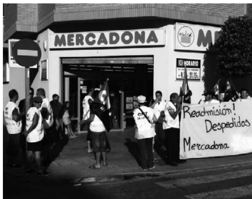
Concentración frente a Mercadona en El Ejido

La CNT ha elaborado un calendario de movilizaciones, emprendiendo una campaña de denuncia ante los clientes de esta cadena