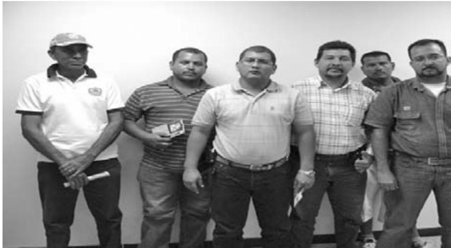
Parte de los trabajadores represaliados en Sidor

La Venezuela de hoy ha confirmado, una vez más, aquellas palabras de Miguel Bakunin: "Si mañana hubiera de establecerse –afirmó el gigante ruso en La política de la Internacional– un gobierno o un consejo legislativo, un Parlamento compuesto exclusivamente de trabajadores, los obreros mismos que ahora son firmes demócratas y socialistas se convertirían en aristócratas no menos determinados, adoradores audaces o tímidos del principio de autoridad, y que también se transformarían en opresores y explotadores". Efectivamente, el recambio burocrático ocurrido en 1999 ha continuado, enmascarándola con un discurso neoizquierdista, las políticas de entrega de los recursos minerales a las transnacionales, el enriquecimiento de nuevas castas de funcionarios y empresarios, ligados a los sectores más álgidos de la globalización, las políticas de reparto de las migajas de la renta petrolera y el control, institucionalización y contención de diferentes movimientos sociales y populares