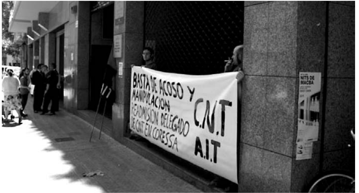
Imagen de una de las concentraciones en apoyo al compañero despedido / CNT CORNELLÁ DE LLOBREGAT

Como no quedaron contentos con la decisión judicial, la empresa recurrió la senten-