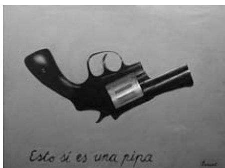
Preiswert, Esto sí es una pipa