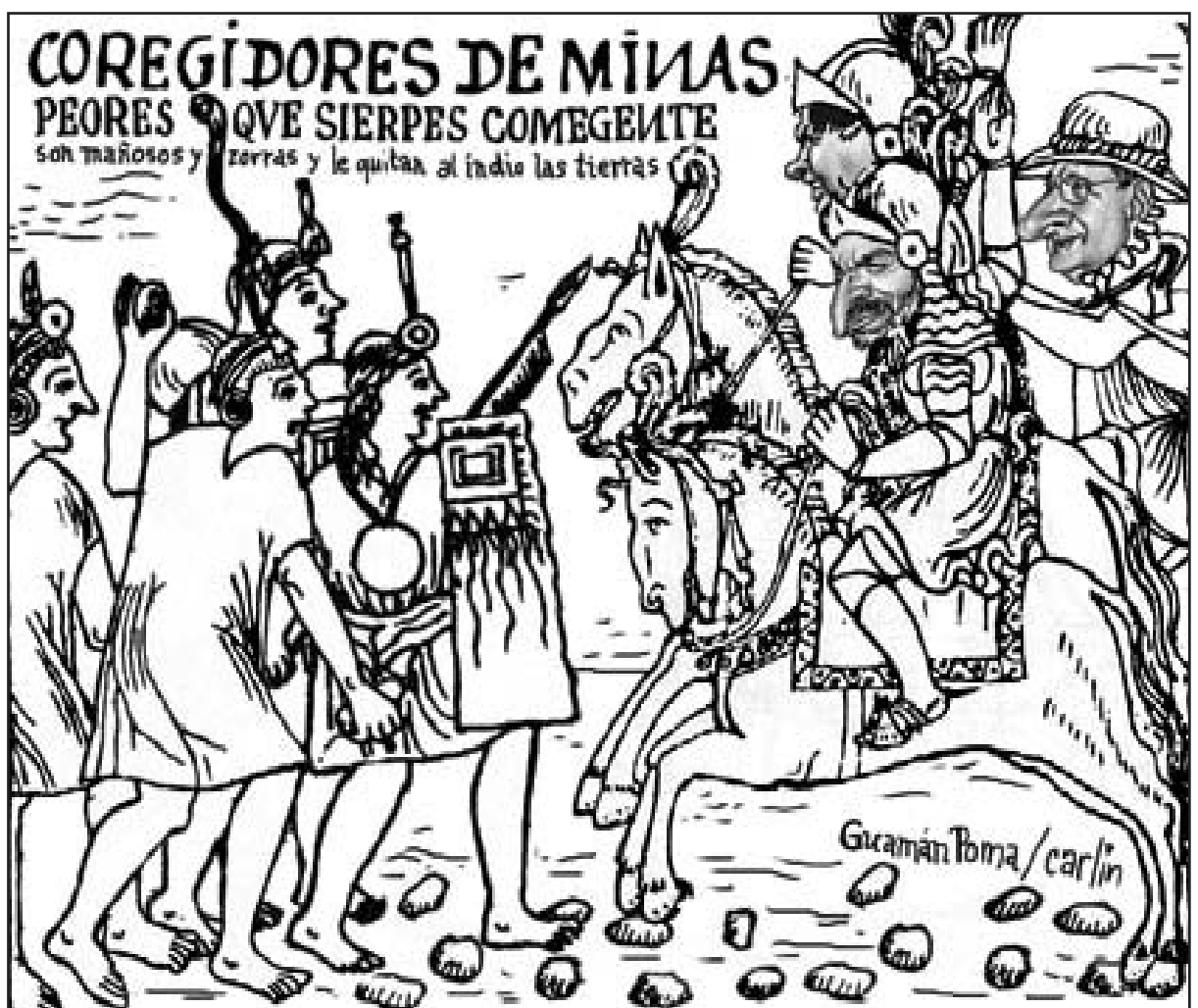
“Carlin 2009, interviniendo una ilustración del clásico Guaman Poma de Ayala”

“ http://www.servindi.org/ ” WWW.SERVINDI.ORG/ agencia indigenista de noticias); Bartolomé Clavero (_ HIPERVINCULO “ http://clavero.derechosindigenas.org/ ” HTTP://CLAVERO.DERECHOSINDIGENAS.ORG/ eximio blog con análisis e información de actualidad, profundos comentarios jurídicos y vínculos con informes de primera mano)