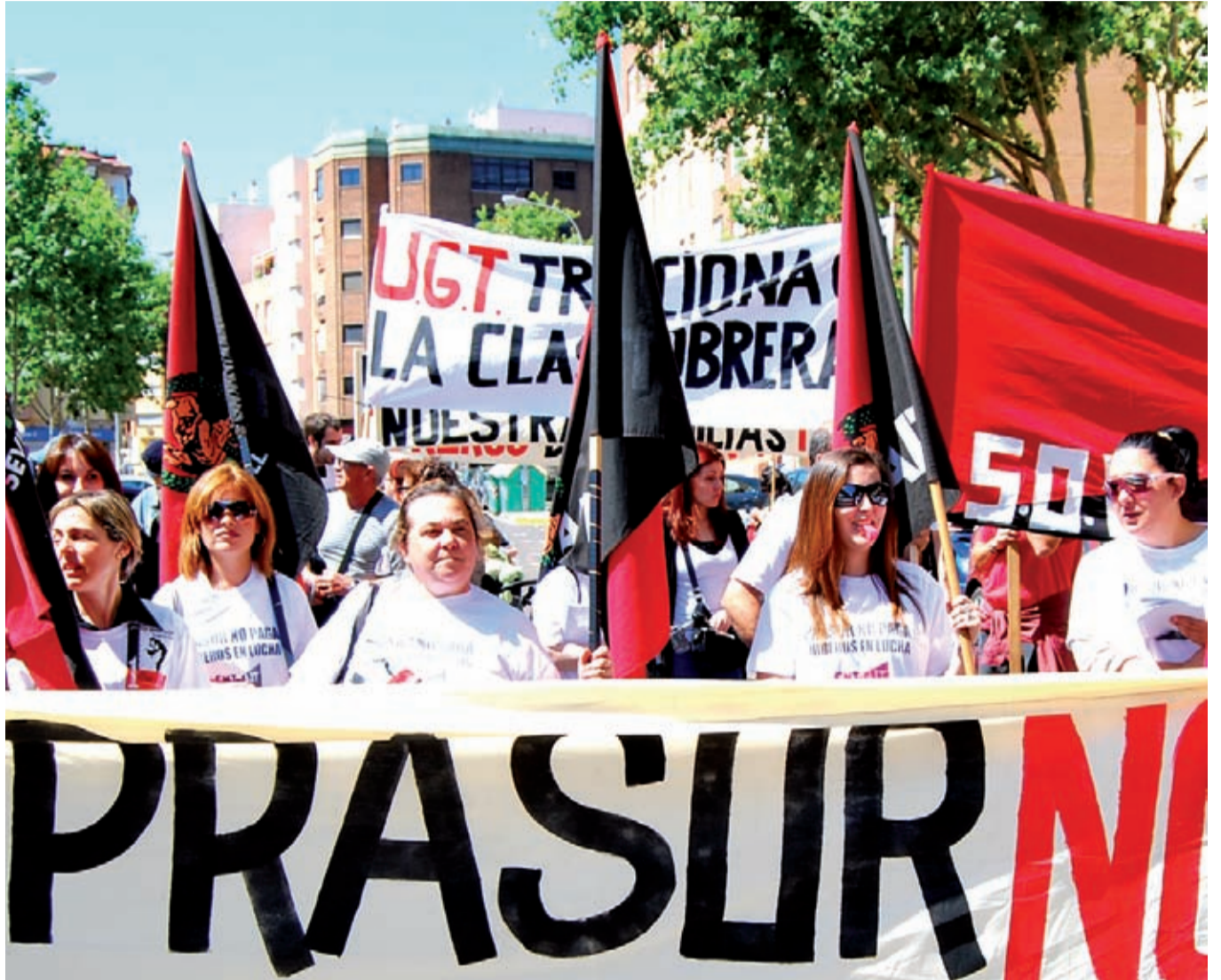
Instantes de una de las manifestaciones de los trabajadores de PRASUR en Utrera / CNT UTRERA

- Fueron muy claros explicando las cosas, lo que no ocurrió con las primeras reuniones que tuvimos con la UGT. Hubo dos, con todos los trabajadores. No fueron claros, pares y noes. Ni dijeron lo que podía suponer. La política de la UGT es como el avestruz, esconder