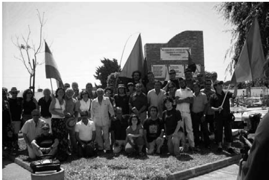
La CNT presente en el acto celebrado el pasado junio