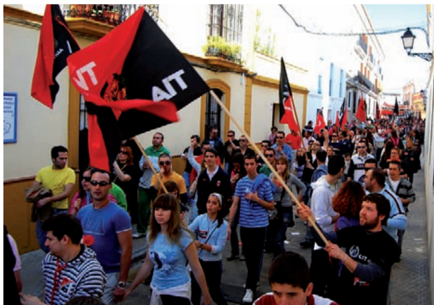
Imagen de una de las manifestaciones realizadas en Utrera en apoyo a los compañeros

Cuando regresamos en el tren, con todas sus palabras grabadas, sentimos que con nosotras también viaja, como una fuerza solidaria, esa esperanza dura que se lee en sus ojos.