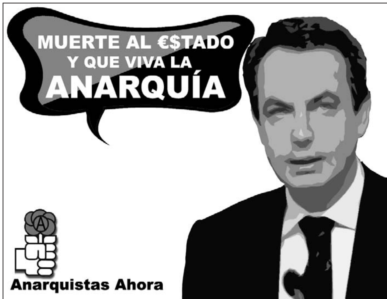
"El Estado es dominio de una minoría de altos funcionarios organizados en cuerpos de lo más elitistas".

Estos vampiros ponen y quitan gobiernos de la nación, pero sobre todo ponen y quitan gobiernos autonómicos, que ahí es donde es más fácil meter el diente: en los reinos de taifas ahora engordados por la financiación repartida por el Estado: un regalo que hacemos los apaleados trabajadores contribuyentes a los verdaderos responsables de las muertes en un sistema sanitario que para nosotros es inexistente, pero para ellos es una hermosa y lucrativa realidad.