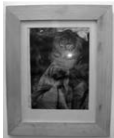
Darío Álvarez Basso