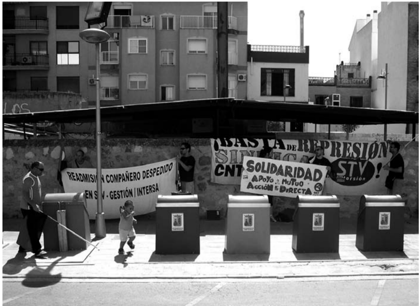
Imagen de uno de los piquetes realizados contra STV Gestión / CNT CARTAGENA

Es en este momento cuando se constituye la Sección Sindical de CNT en la empresa. Los trabajadores deciden seguir adelante con la lucha, recuperar su autonomía y empezar a tomar sus propias decisiones. Apro-