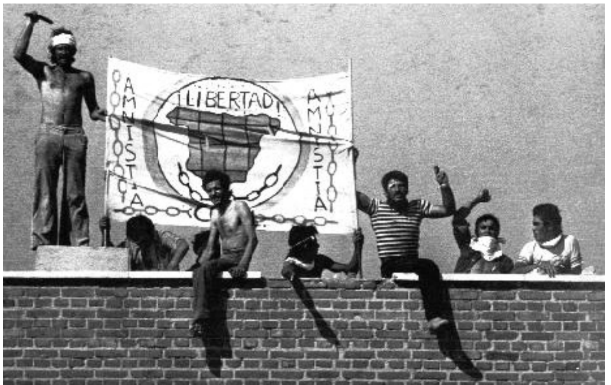
En la imagen, una de las acciones de la COPEL, colectivo que llegó a ser un referente en la lucha anticarcelaria en el estado español.

Las personas presas de decenas de prisiones del Estado, (Carabanchel, modelo de Barcelona, nueva modelo de Valencia, Soria, Málaga, Córdoba, Sevilla, Penal del Puerto de Santa María, Badajoz, Cádiz y algunas mas...) de forma coordinada,