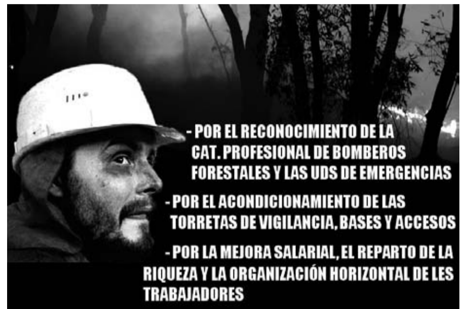
Cartel Concentración Bomberos Forestales en Toledo / CNT GUADALAJARA

2.Reconocimiento de las Unidades de Emergencias, ya que este es el servicio que se realiza según las leyes.