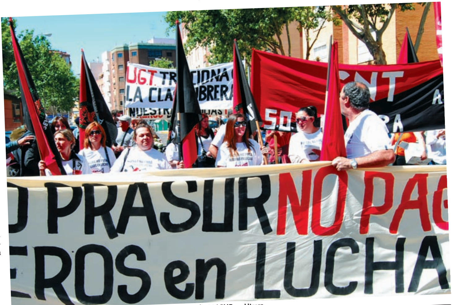
Instantes de una de las manifestaciones de los trabajadores de PRATUR en Utrera

L levamos más de un año denunciando desde estas páginas que la crisis económica que provocó la rapiña capitalista azota a los trabajadores de todo el mundo. La respuesta a la desmesura patronal no puede ser otra que la total confrontación obrera para la defensa de nuestros derechos individuales y de clase. De otro modo nos enfrentaremos a más paro, menores salarios, más canalladas; mientras los nuevos y viejos ricos alardean de sus títulos de propiedad lunática. En las páginas que siguen relatamos los muy dignos ejemplos de la tesón de la afiliación cenetista en la defensa de los derechos de los trabajadores. En Gaceta sindical y económica: entrevistas con los compañeros del servicio de limpieza viaria de Pilar de la Horadada (Alicante) y con compañeras afectadas por los impagos de Pratur en Utrera (Sevilla).