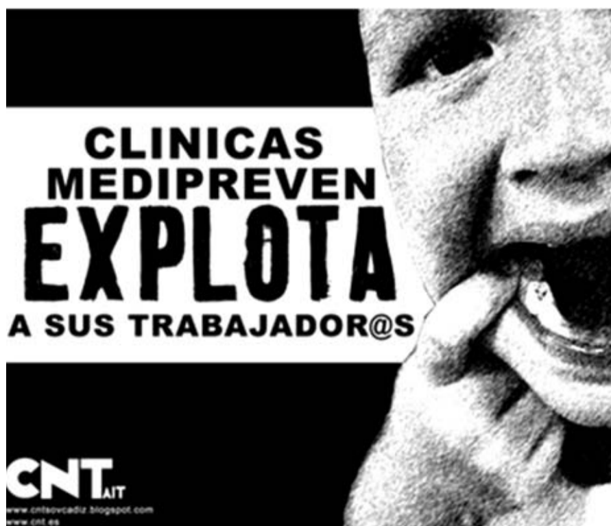
Cartel contra MEDIPREVEN / CNT CÁDIZ

El responsable de este atropello se llama