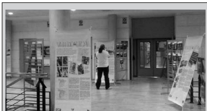
"Viviendo la Utopía" en Sagunto

Posteriormente la muestra fue trasladada a la Casa de la Cultura de Quart de les Valls donde permaneció expuesta del 25 al 27 de junio.