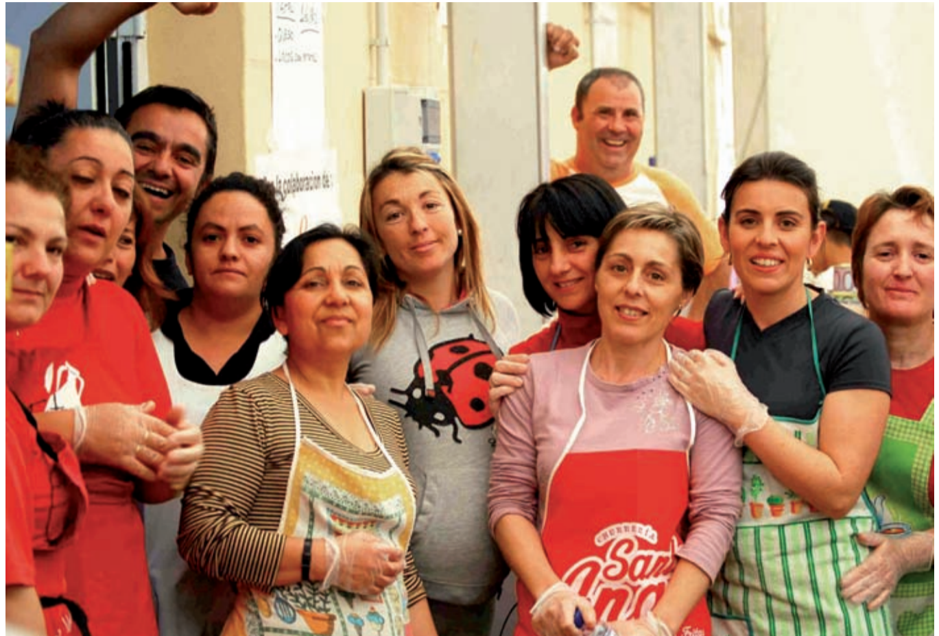
En el Festival Solidario con las familias de PRASUR / CNT UTRERA

tengo muy claro que me afilio a la CNT y que cuando haga falta salir por algún motivo, que me llamen, que estoy ahí.