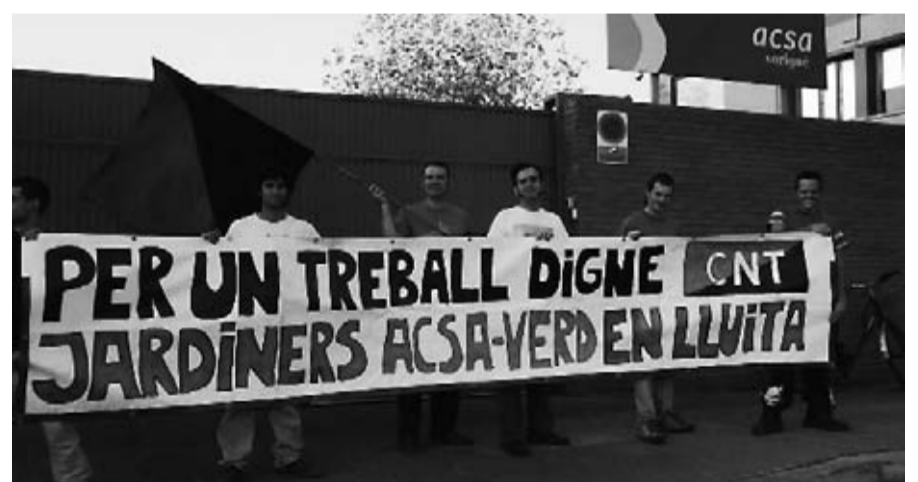
Protesta sindical ante las puertas de ACSA / CNT BARCELONA

Rota la unidad entre el Ayuntamiento y ACSA, los empleados del servicio municipal en huelga valoraron el pasado 8 de julio en asamblea cambiar de estrategia y abandonar por