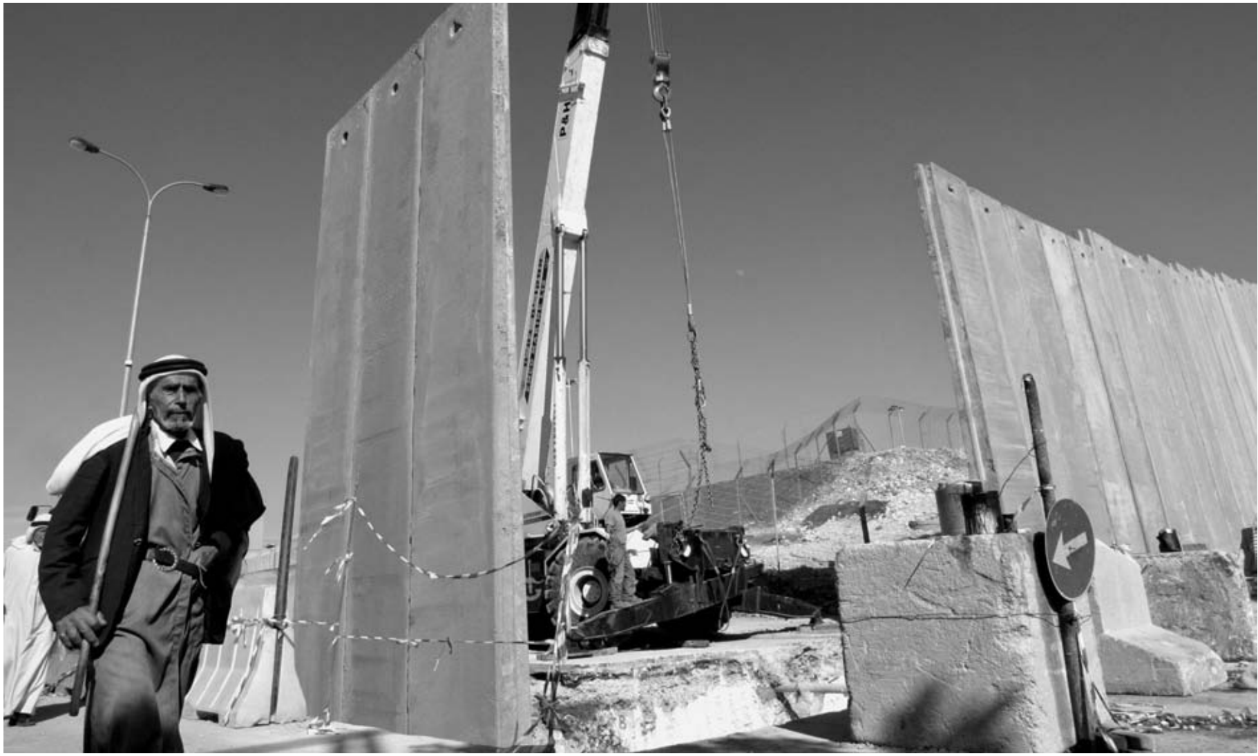
El estado de Israel sigue con la construcción del muro segregacionista en contra de la legalidad internacional

Internationale Arbeiter Assoziation Associazione Internazionale dei Lavoratori Международная Ассоциация Работников