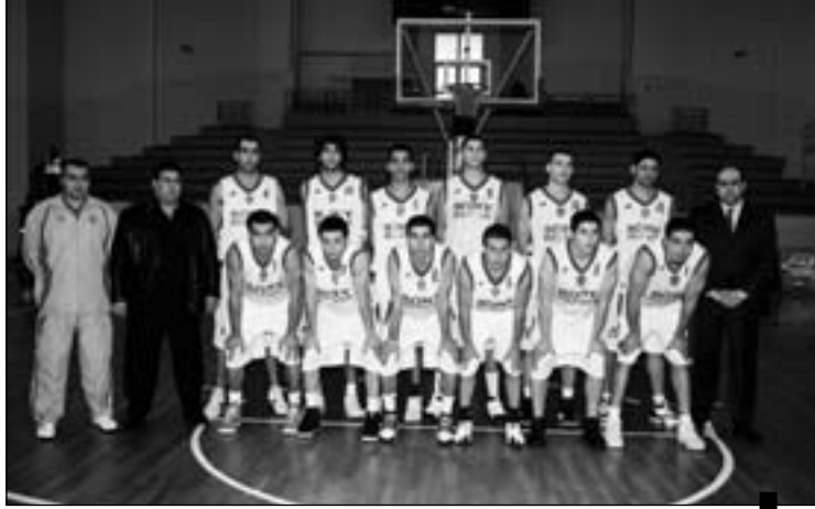
المنتخب الوطني لكرة السلة