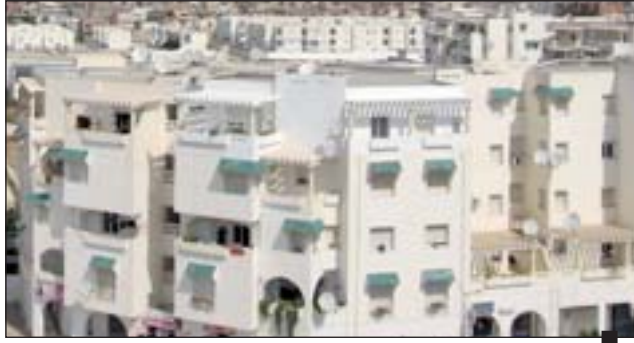
المسكن يتطور عموديا في تونس

أصدر مؤخرا المعهد الوطني للإحصاء نتائج المسح الوطني للسكان والسكن لسنة 2009 وهو مسح يتم اعداده كل خمس سنوات. وقد شمل عينة تعد قرابة 162.500 أسرة ممثلة لكامل أسر الجهات وموزعة على 6500 مقاطعة من مختلف الولايات والمدن والقرى والأرياف.. وقد احتضن هذا المسح بإضافة محور يتعلق بالمساكن وبخصائصها لتقييم التطور الحاصل بالمقارنة مع التعداد العام للسكن والسكنى لسنة 2004.