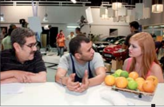
سيتموم «قاراج الكريك»