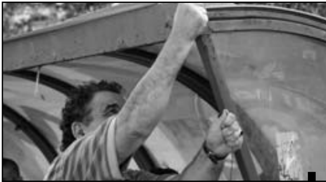
فوزي البنزرتي: نربط بالثل ثماش ما تولى خير من قبل!؟