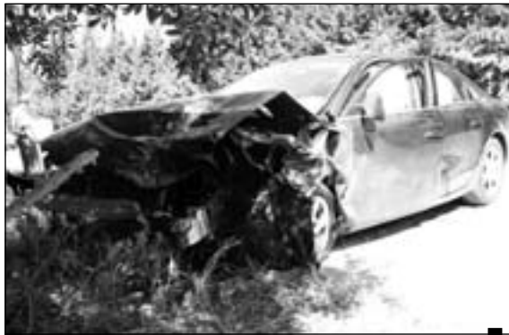
التعب وقلة الانتباه من أهم أسباب حوادث المرور

كانت حصيلتها 153 قتيلا وبما أن رمضان تزامن مع شهر أوت أخطر أشهر السنة من حيث الحوادث وعلى اعتبار حالات التعب خلال الشهر الفضيل التي تكون بدورها وراء عديد الحوادث فإن الحذر واجب لأن ارتفاع الحرارة مع التعب والسهر كلها عوامل ترفع من احتمالات حصول حوادث مرور وحوادث مرور خطيرة.