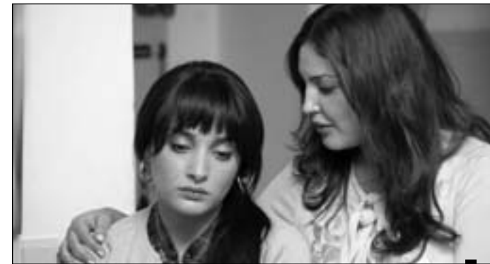
لقطة من «أيام مليحة»

الفنية باعتبار مشاركتي في عديد المهرجانات بمهرجانات المدينة».