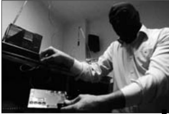
جواسيس... لإعادة تغذية بنك المعلومات الاسرائيلي

سابق له في تاريخ الصراع مع الدولة العبرية. أما نوعية العملاء فتدل على شيء آخر، فإسرائيل تختارهم من جميع الطوائف والمذاهب والمناطق والاهتمامات السياسية، بغض النظر عن اقتراب هؤلاء من هدفها الأساسي، أي حزب الله أو ابتعادهم عنه، ووصلت بها الأمور إلى حد اختراق معظم المؤسسات الأمنية اللبنانية من جيش وقوى أمن وأمن عام عبر مجموعة من العملاء كما دلت التوقيفات الأخيرة.