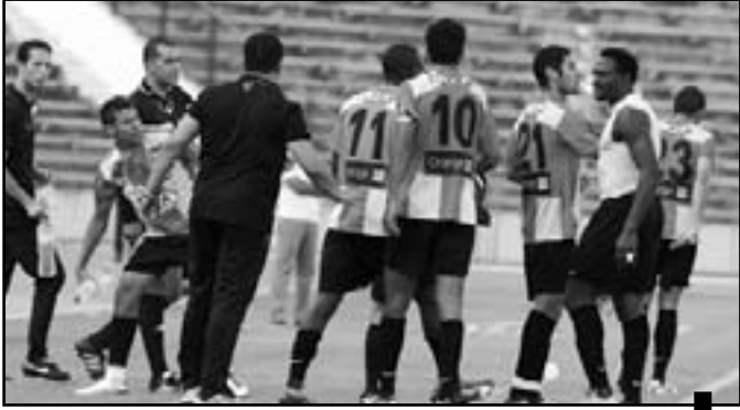
الكنزاري: سي مايكل ضحكولو تمد على طولو... رمى علي مريولو

تعليق م. الحكيري