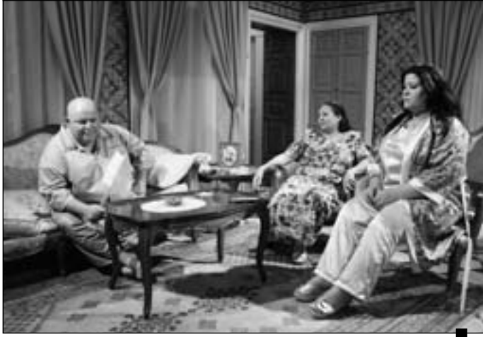
مشهد من «نسيبتي العزيزة»

في الوقت الذي أحدثت فيه شركات قيس نسب المشاهدة جدلا واسعا في الوسط الاعلامي أدى إلى احتجاجات كان يمكن تلافيها اختلفت آراء المشاهدين بشأن الانتاجات الرمضانية في مختلف القنوات التونسية بشكل يعكس اختلاف أذواقهم لتنوع فئاتهم العمرية ومستوياتهم الفكرية. وفي ظل هذا الاختلاف ارتابنا استبيان آراء الفنانين في البرمجة الرمضانية وفضلنا سير مواقف نجوم الغناء فقط بعيدا عن نجوم التمثيل بهدف تلافي الحساسيات والحسابات الضيقة إن وجدت.