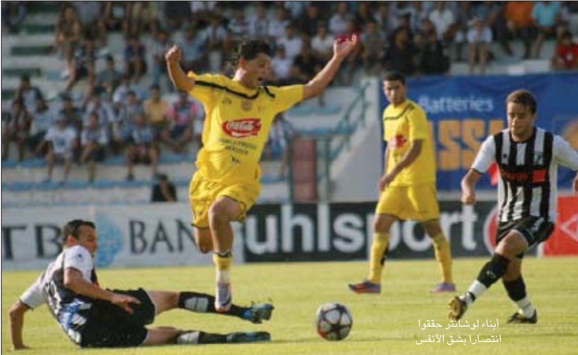
أبناء لوشانتر حققوا انتصارا بشق الأنفس