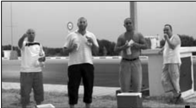
جماهير السي آبي: على خاطر الجمعية نشقو الفطر في الثنية