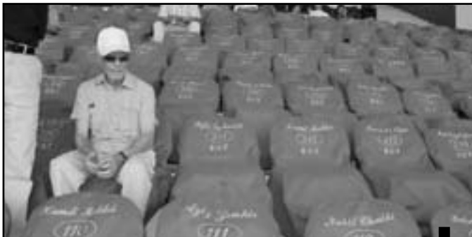
منصة منظمة وتعمل الكيف... والمهم ما تكونش حدها الصيف