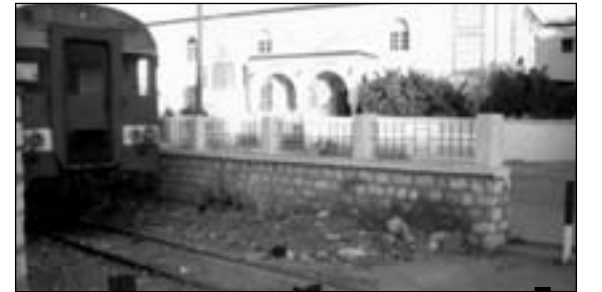
موقع الحادث... ويظهر القطار