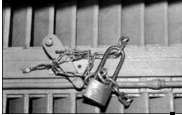
الباب الرئيسي محكم الغلق