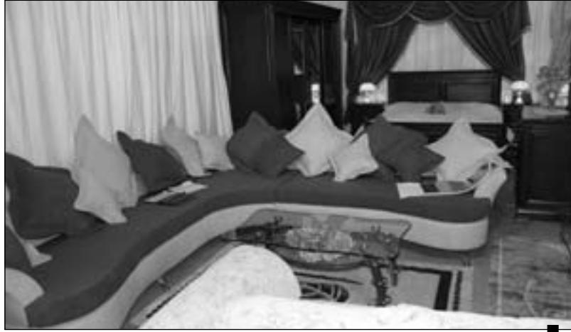
العقل والتنفيذ مشاكل بالجملة خصوصا إذا ما تعلق الأمر بأثاث المنزل