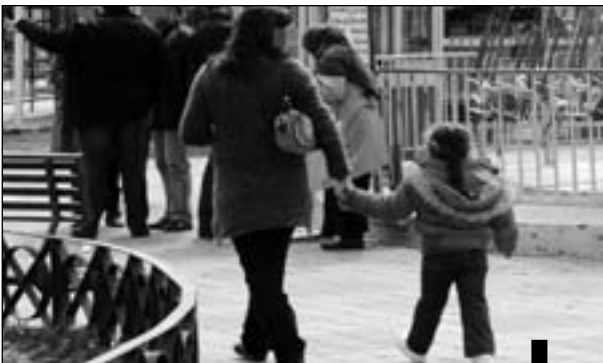
التبني يحمي فاقد السند من الضياع