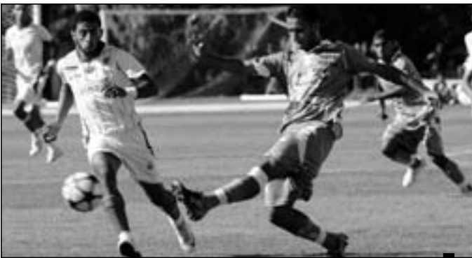
التعادل الثالث لأبناء باجة لا يخدم مصلحتهم