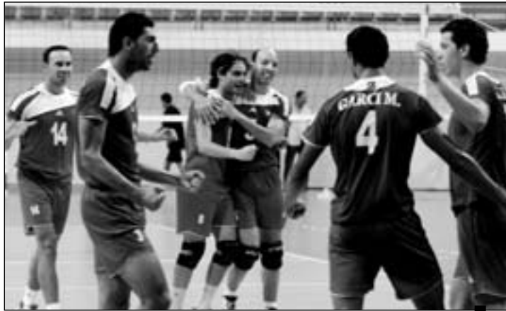
المنتخب التونسي للأكاير

التي ستقام بجنوب افريقيا من 14 إلى 22 سبتمبر 2010