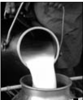
احذروا الحليب ومشتقاته