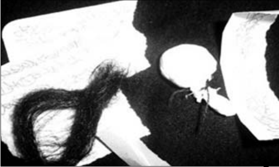
خصلة شعر... وكلام مكتوب مع أظافر... وصفة سحرية لنيل المطلوب

شرب ماء غسل الميت... وضع «الفاسخ والفيسوخ» في حذاء العريس وإخفاء محتويات «قفة العقيرة»