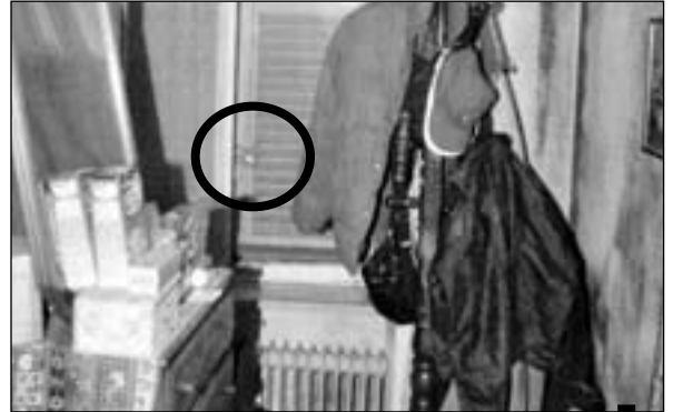
النافذة مغلقة بالأقفال من الداخل