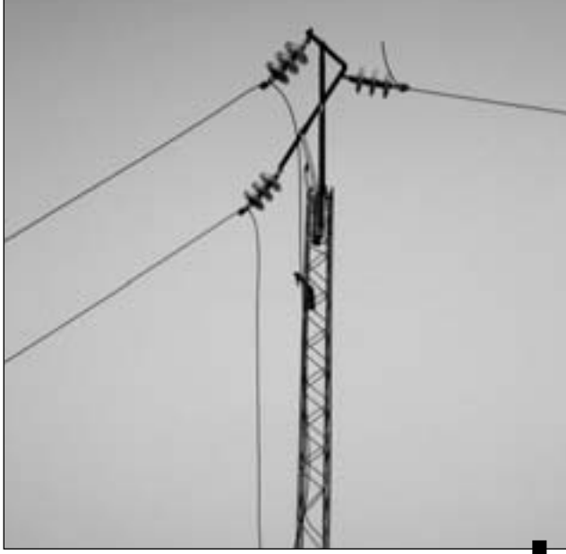
نشاط الشبكة كثيرا ما تستهدف الأسلاك الكهربائية

الحكمة والحرفية المعهودة لمحقيقي فرقة الأبحاث والتفتيش للحرس الوطني بفوشانة فقد تمكنوا بعد فترة من