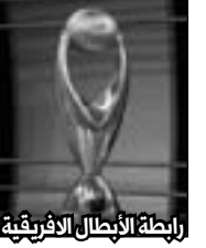
رابطة الأبطال الإفريقية

مادمننا نتحدث عن التغييرات بمناسبة هذه المباراة