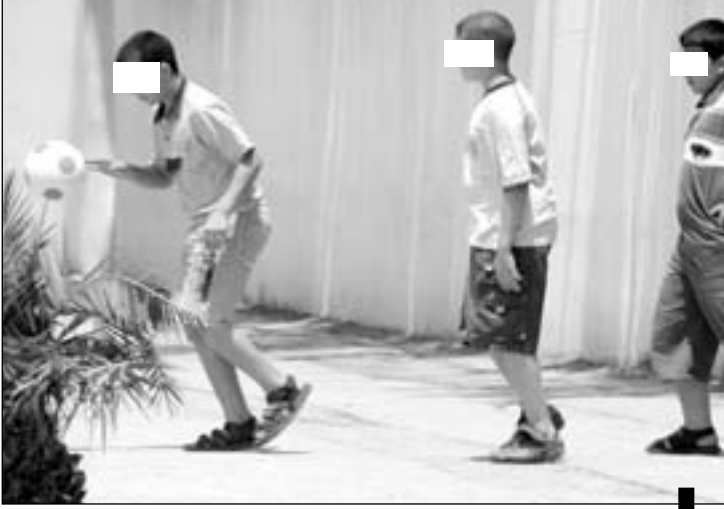
مؤسسات رعاية الطفولة تضم 6438 طفلا

سيبدأ العمل منذ انطلاق السنة الدراسية المقبلة على إعداد مشروع إدماج لكل طفل منذ التحاقه بأحد مؤسسات الرعاية سواء كانت مركز مندمج أو مركب طفولة وبهم خاصة الأطفال ممن لهم عائلة إلا أنه لظروف مادية أو اجتماعية تتخلى عنه هذه العائلة ويقع إلحاقه بأحد المؤسسات المذكورة آنفا تماشيا مع منظومة حماية الطفولة المهددة وتكريسا لأليات تدخلها الوقائي والعلاجي ويرتكز هذا المشروع على تشخيص دقيق لواقع الطفل وعائلته وتحديد حاجياته داخل المؤسسة وخارجها للملائمة التدخلات لفائدته ولفائدة أسرته ويهدف هذا المشروع إلى تنسيق الجهود للعمل على إرجاع الطفل إلى عائلته للتقليص من مدة بقائه بالمؤسسة وذلك من خلال مخطط تدخل فردي خاص بكل طفل منذ توجيه ملفه للمؤسسة.