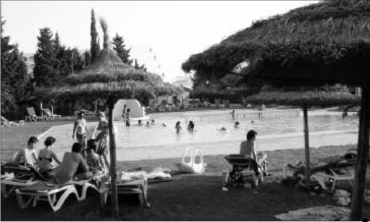
السياحة الشاطئية نعمة قد تتحول إلى نقمة على القطاع

كاتب عام الجامعة التونسية لوكالات الاسفار: