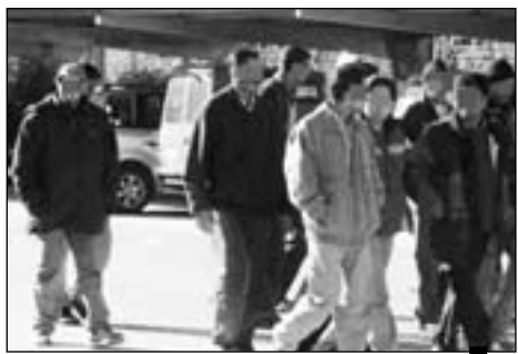
جانبا من عملية الترحيل

واصلت السلطات الإيطالية تنفيذ برنامجها لمكافحة الهجرة غير الشرعية، وفي هذا الصدد قامت قبل أيام بترحيل «34 حارقا» يحملون الجنسية التونسية والمغربية كانوا معتقلين بمركز وقي بمنطقة فيمينال.