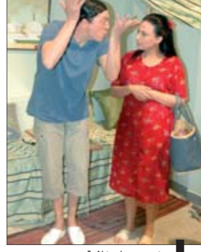
مشهد من دار خلاعة