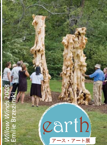
Willow Winds 2008 Emilie Brzezinski