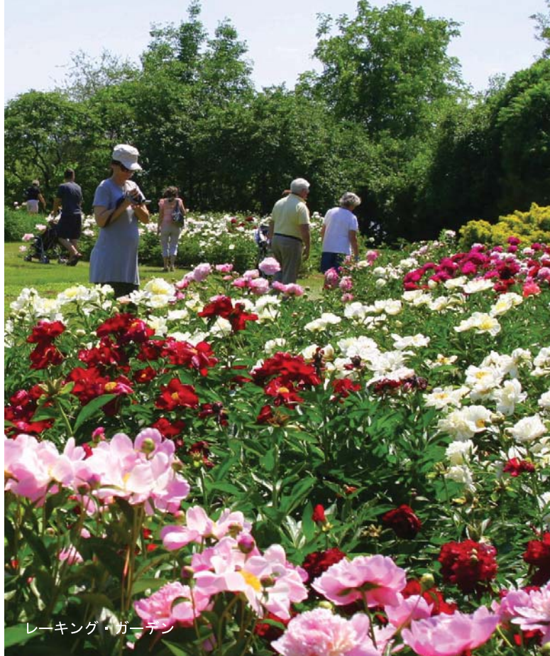
レーキング・ガーデン