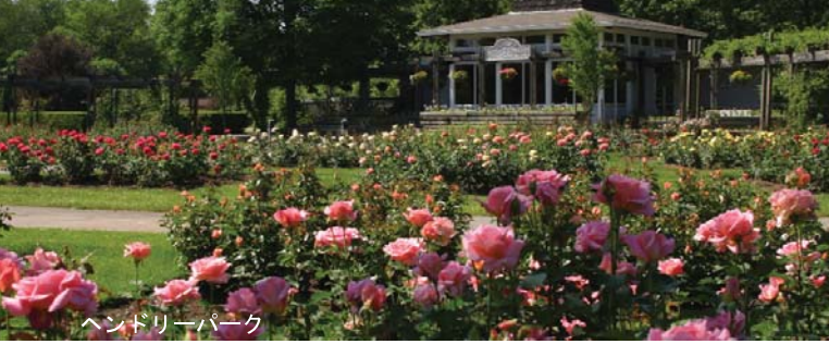
ヘンドリーパーク