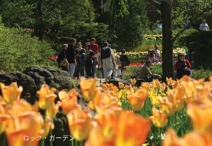
ロック・ガーデン