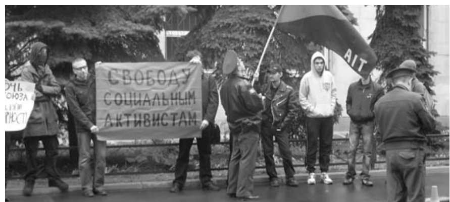
Piquete ante la Embajada de Ucrania en Moscú el 21 de abril

ait.org ). El 21 de abril, dos piquetes se manifestaron frente a la embajada ucraniana en Moscú por parte de activistas de "Autonomous Action" (AD), anarquistas independientes y por la KRAS-IWA, sección rusa de la AIT. A las concentraciones asistieron en total alrededor de 30 personas. Las pancartas decían: "¡Libertad para los activistas sociales!", "¡Quitad vuestras manos de Direct Action!", "¡Solidaridad!". En el curso de las acciones, se distribuyeron folletos en demanda del cese de las represiones contra los activistas sindicales de Kiev. En general, el piquete se llevó a cabo sin incidentes. KRAS "les desea [a PD] un éxito continuado en la lucha, y espera que pronto cese la represión por parte de los servicios secretos de Ucrania".