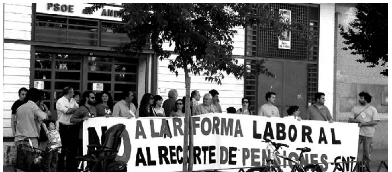
Trabajadores del sector público, de empresas privadas y parados se concentraban el 19 de mayo ante la sede del PSOE

Dicen que estamos en una situación de emergencia y que tenemos que arrimar todos el hombro y hacer un esfuerzo, pero, ¿qué esfuerzo le están pidiendo que hagan a las grandes empresas y a los Bancos que cotizan en Bolsa, que han aumentado sus beneficios un 25% en los primeros tres meses de este año? El Banco Santander ha tenido en el primer trimestre del año unos beneficios de 2.215 millones de Euros; el BBVA 1.240 millones; Telefónica 1.656