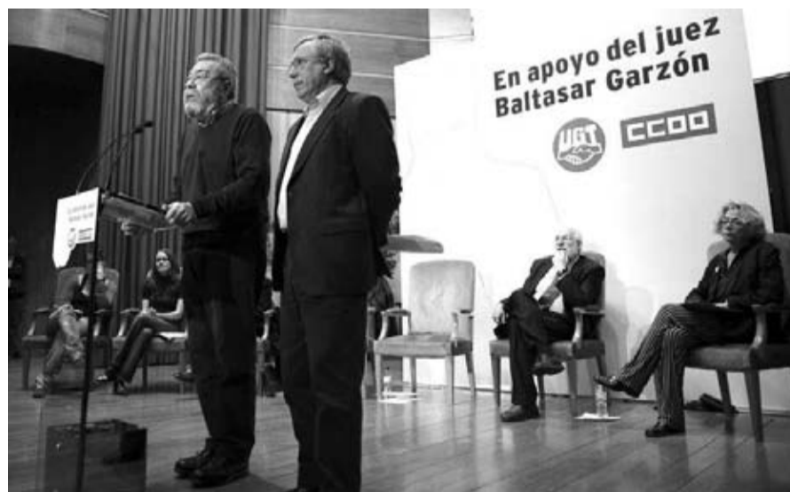
El rector de la Universidad y los líderes sindicales, en pleno acto de cinismo durante el reciente acto de apoyo al juez Garzón.

Hipócritas son desde luego los organizadores de este acto, los sindicatos verticales CCOO y UGT, o agentes sociales como últimamente prefieren que les llamen, que siguen embaucando a millones de trabajadores y trabajadoras autoproclamándose como representantes de sus intereses, y que ante el descrédito general en el que están cayendo ante la clase obrera han decidido encabezar ahora la lucha por la denominada Memoria Histórica. Desde luego que se estarían revolviendo en sus tumbas