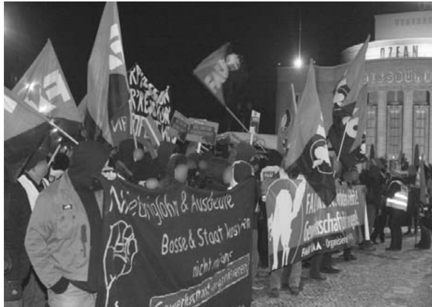
Cabecera de la manifestación del 19 de diciembre en Berlín a raíz de la prohibición a la FL berlinesa de la FAU para denominarse como sindicato/FAU

Está el DGB: un gran sindicato que se considera a sí mismo un proveedor de servicios, en el que los trabajadores participan en su mayoría indirectamente, y que es tan grande que los trabajadores de compañías pequeñas a menudo se quedan en el camino. Luego, hay distintas formas de sindicatos "amarillos", organizaciones controladas por los jefes. Por buenas razones, a éstos a menudo los tribunales les prohíben firmar convenios, debido a