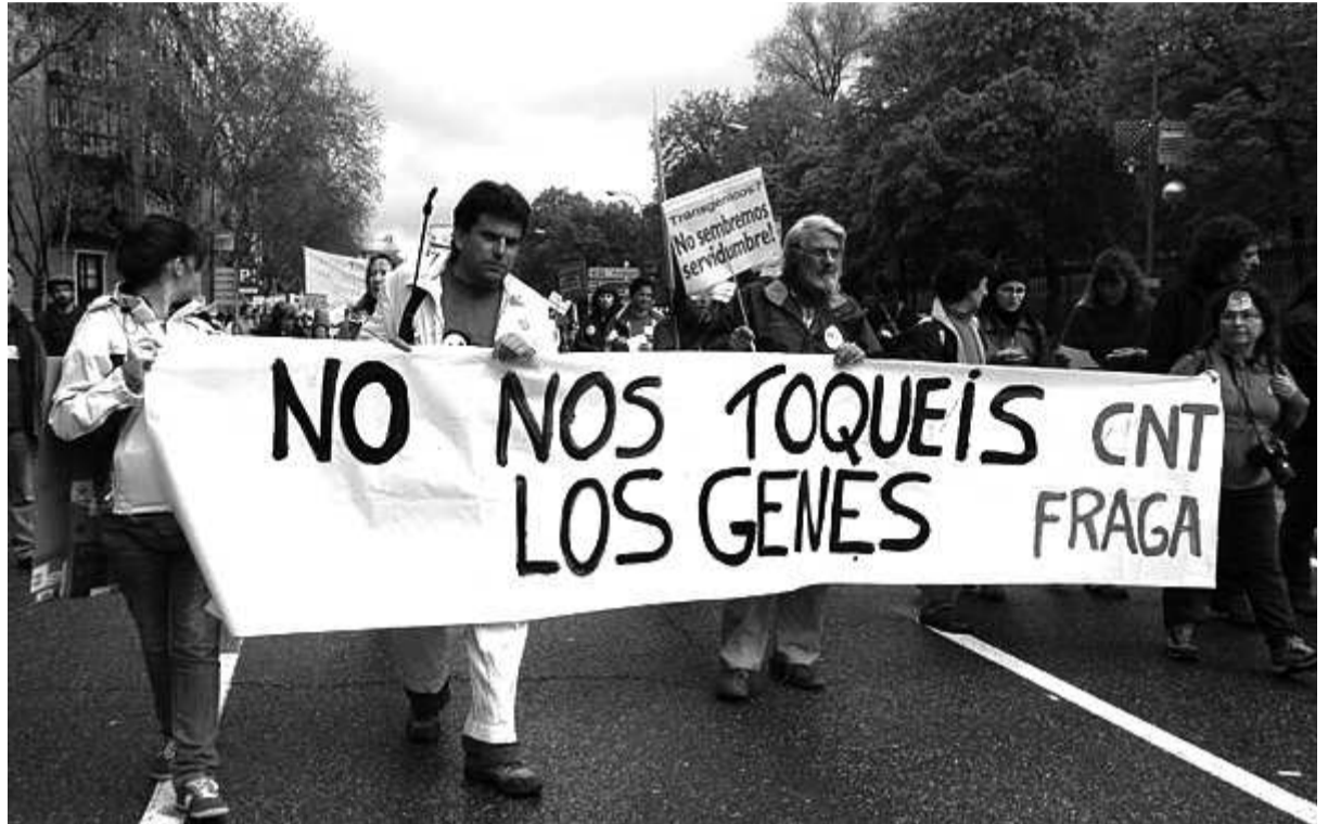
Más de 15.000 personas acudieron a Madrid el pasado mes de abril para protestar contra los transgénicos. Al acto acudió una representación de la CNT de Fraga para ofrecer la visión anarcosindicalista del problema.

Con la aprobación de estos nuevos cultivos modificados genéticamente no sólo se añaden nuevos riesgos alimentarios, sino que se perpetúa un sistema productivo que está dejando en manos de unas multinacionales nuestra alimentación