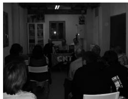
Charla de la CNT en la Librería la Hormiga Atómica

La asistencia al acto fue concurrida y sobre todo fue agradable contemplar la gran cantidad de preguntas e intervenciones que hubo en el debate. Es positivo que la CNT se muestre y que la Idea se difunda entre la mayor cantidad posible de personas.