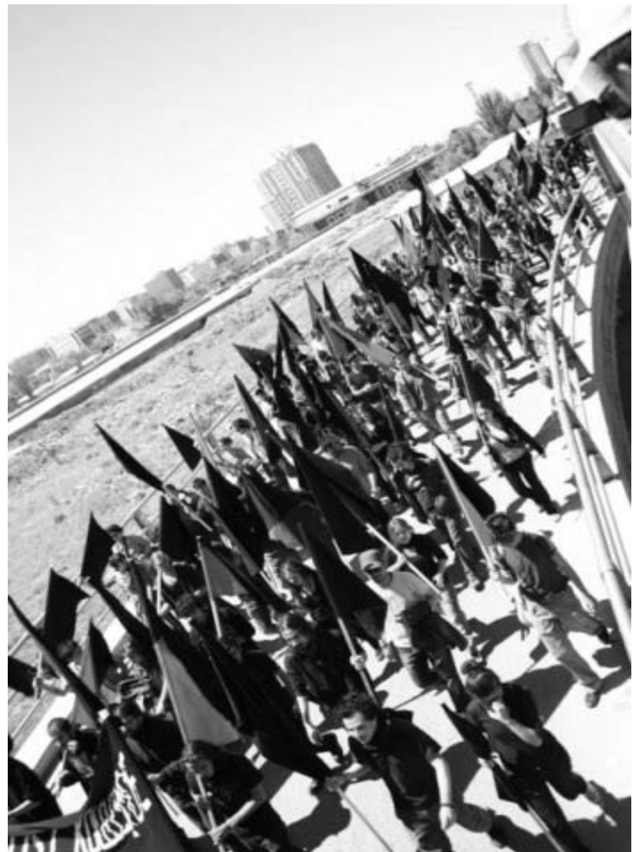
Manifestación del 1 de mayo de 2010 en Turquía

Los delegados español y alemán dicen estar “satisfechos al haber comprobado el buen estado de salud de la sección de la AIT en Italia. La honestidad de los compañeros y compañeras y el espíritu de lucha que se respira nos hizo sentir desde el primer minuto como en casa, en la casa de los que llevan un mundo nuevo en sus corazones”.