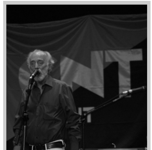
En plena faena el 29 de abril

En unos meses Javier Krahe tendrá que comparecer en un juicio oral por causa de su ateísmo. El motivo, una entrevista emitida en Canal Plus en 2004. El centro jurídico Tomás Moro interpuso una querrela criminal por un vídeo (realizado en 1978) incluido en el reportaje, en el que se mostraba "cómo cocinar un Cristo para dos personas", entendiendo que su emisión era constitutiva de un delito contra los sentimientos religiosos. El cantante madrileño se encuentra ante una petición de la jura de 192.000 euros de fianza y una multa de 14.400 euros.