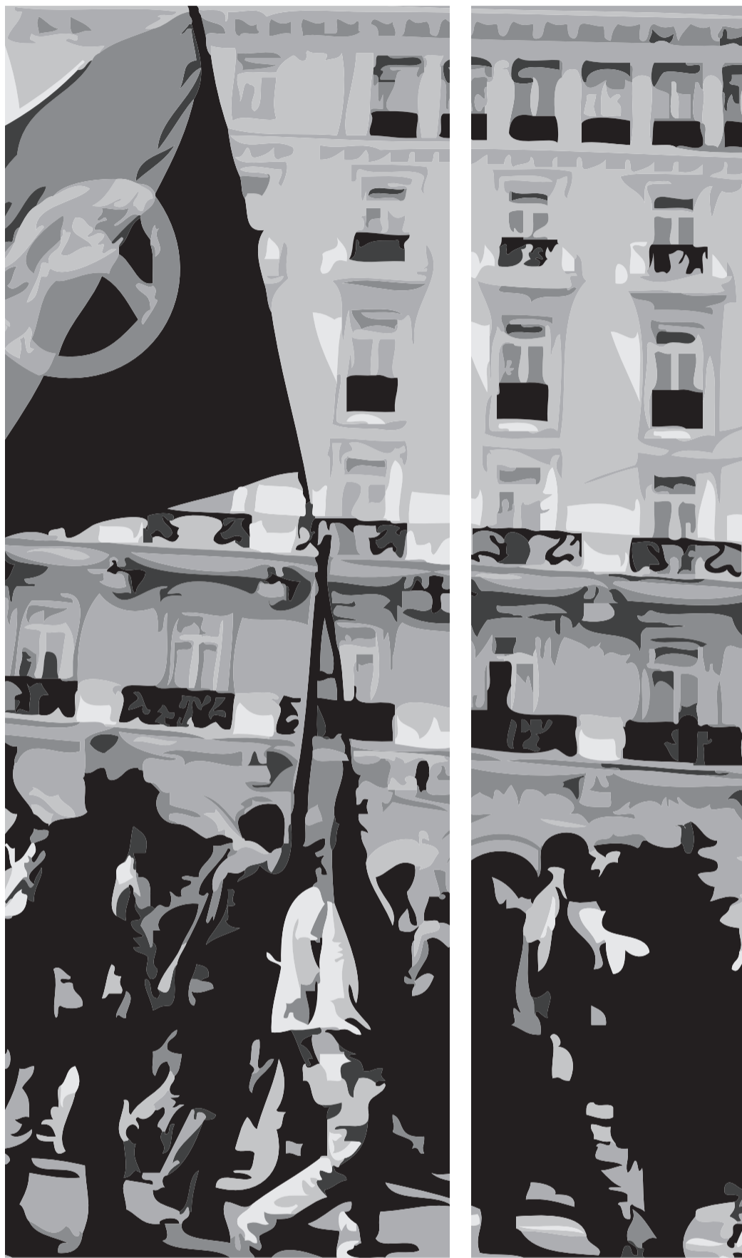
Manifestación en las calles de Atenas el pasado Primero de Mayo

to rápidamente, sin tener que mendigar créditos de las élites extranjeras que (con el único fin de lucrarse, ¡como no!) han impuesto unas condiciones onerosas que las generaciones venideras tendrán que pagar durante muchos años. Todo esto, a pesar de que fueron esas mismas élites y clases privilegiadas las que crearon y se beneficiaron principalmente de la deuda y la consiguiente "burbuja" de crecimiento a la que dio lugar.