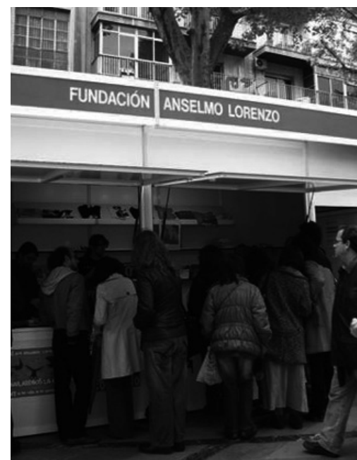
Caseta de la FAL en la Feria del Libro de Granada

Queremos expresar nuestro agradecimiento a los autores que dieron gran color a esta Feria e impulso a la FAL en Granada. El stand fue, como en otras ocasiones, un tremendo éxito, pues a pesar de la especialización del tema, la originalidad y el espacio para un tema como es el movimiento obrero y el libertario despertaron un gran interés en nuestra ciudad.