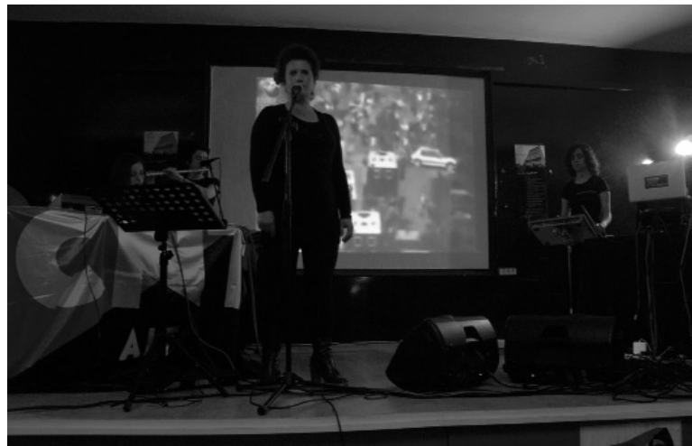
Momento de la actuación el pasado 1 de mayo en Villaverde, Madrid.

Como dice el folleto que repartimos al público con la obra: "desde el momento que pasado y futuro son parte del mismo lapso de tiempo, el interés en el pasado y el interés en el futuro están plenamente in-