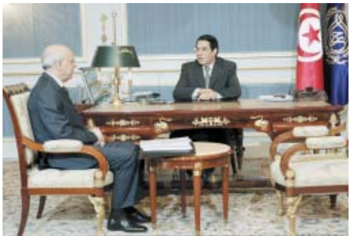
Le Chef de l'Etat conférant avec le Premier ministre P 4