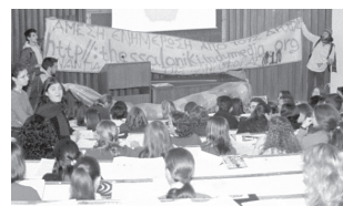
παρέμβαση στα πανεπιστήμια μα νοέμβριος 2001

η ίδρυση του indymedia thessaloniki ήταν κυρίως η απάντηση στην ανάγκη για δημιουργία μιας σταθερής δομής αντιπληροφόρησης