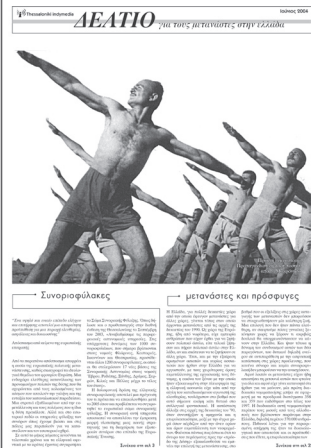
δελτίο για τους μετανάστες (έκδοση: Ιούνιος 2004)

Θα θέλαμε η επίσκεψη στο imc thessaloniki να ήταν μια συνειδητή πολιτική κίνηση και όχι ένα εναλλακτικό σερφάρισμα που γεμίζει απλώς τις μοναχικές χειμωνιάτικες νύχτες