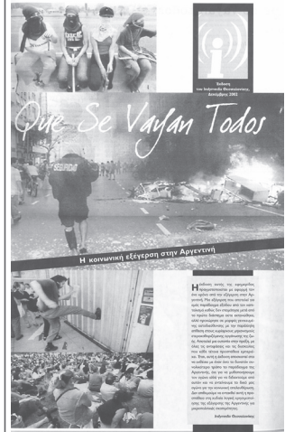
Que Se Vayan Todos: εφημερίδα για την κοινωνική εξέγερση στην Αργεντινή (έκδοση δεκέμβριος 2002)

μετά τον Ιούνιο του 2003, η συνέλευση ατόνησε με αποτέλεσμα η ενημέρωση της σελίδας να γίνεται εργαλειοκά και πρωτοβουλιακά και όχι συλλογικά.