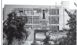
το κατειλημμένο κτήριο της νομικής: Κοινωνικό Ανεξάρτητο Κέντρο Ενημέρωσης

Ήταν η πρώτη φορά σε παγκόσμιο ραντεβού που το IMC στήθηκε από ντόπιους, σε δικό του χώρο, με όρους λειτουργίας καθαρά αντιεξουσιαστικούς.