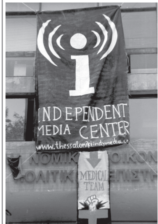
το κατειλημμένο κτήριο της νομικής: Κοινωνικό Ανεξάρτητο Κέντρο Ενημέρωσης

Αφού οι δράσεις ενάντια στη σύνοδο κορυφής θα συνέβαιναν στην πόλη μας, με ή χωρίς τη συμμετοχή μας, δεν μπορούσαμε παρά να συμμετέχουμε.