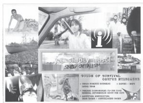
οδηγός επιβίωσης έκδοση του imc thessaloniki τον Ιούνιο του 2003

Ο στόχος της ομάδας του IMC για τον Ιούνιο ήταν να στηθεί ένα Ανεξάρτητο Κέντρο Αντιπληροφόρησης, βασισμένο στις αρχές της αντιεραρχίας και της αυτοοργάνωσης, σε δικό του ανεξάρτητο χώρο μέσα στο χώρο των πανεπιστημίων, με επαρκή υλικοτεχνική υποδομή.