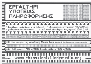
flyer για το Εργαστήρι Υπόγειας Πληροφόρησης - Μάης 2004